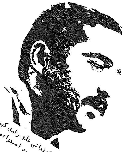
جودك فدائی خلق رفیق کبیر شهید مسعود احمدزاده