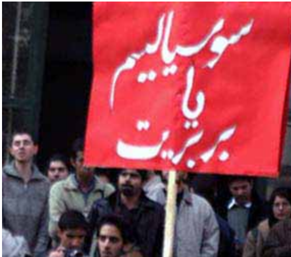
دانشگاه تهران - ۱۶ آذر ۱۳۸۵