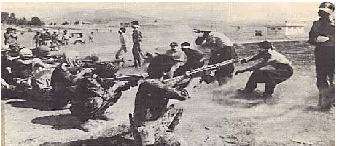
صحنه ای از اعدام فرزندان مبارز خلق کرد توسط مزدوران رژیم وابسته به امپریالیسم جمهوری اسلامی، در اولین ماه های به قدرت رسیدن حکومت

و از ظهور و فعالیت آن چند سالی بیش نمی گذرد. ارتفاعات قندیل و همچنین نواحی کوهستانی نوار مرزی ایران و ترکیه پایگاه اصلی فعالیت پژاک می باشد. به گزارش مطبوعات، جمهوری اسلامی زمستان گذشته سپاه پاسداران ایران عملیات گسترده ای را علیه پژاک به اجرا در آورد که طی آن تعدادی از اعضای این گروه، از جمله سه تن از فرماندهانش کشته شدند. در این عملیات شماری از اعضای سپاه پاسداران نیز کشته شدند که یکی از آنان سرتیپ سعید قهاری، فرمانده لشکر سوم نیروی زمینی سپاه بود که بر اثر سقوط هلیکوپتر حامل خود در منطقه موسوم به جهنم دره در شهرستان خوی همراه با هفت نفر از همراهانش به هلاکت رسید.