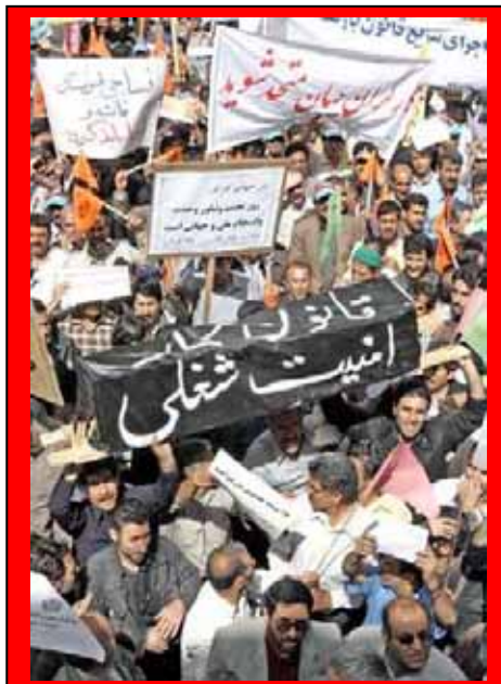
"امنیت شغلی" از خواسته های مبرم کارگران

شرایطی که سرازیر شدن درآمدهای نفتی در سالهای اخیر به جیب دولت در یک نظام دمکراتیک و مردمی بطور طبیعی منجر به افزایش رفاه عمومی، ایجاد مشاغل جدید و رشد و سازندگی اقتصادی به نفع آحاد جامعه می شد، در عوض ما می بینیم که در سالهای اخیر بنا به گزارش بانک مرکزی رژیم، از دوره ریاست جمهوری خاتمی فریبکار تاکنون (۱۳۷۶-۱۳۸۵) واردات جمهوری اسلامی از ۹ میلیارد دلار به نزدیک ۵۰ میلیارد دلار افزایش یافته و در دولت احمدی نژاد نیز دارد از مرز ۵۰ میلیارد دلار می گذرد. در واقع درآمدهای ناشی از حراج نفت و گاز به دولتها و کمپانیهای امپریالیستی از طریق واردات بی حد و حساب کالاهای مصرفی و غیر مولد بر مبنای سیاست های رژیم وابسته به امپریالیسم جمهوری اسلامی دوباره به جیب امپریالیستها و دول غارتگر جهانی باز گشته است. امری که از جنبه دیگر خود منجر به نابودی هزاران شغل در رشته های تولیدی مختلف، ورشکستگی روزمره دهقانان زحمتکش و بیکاری و اخراج هزاران هزار کارگر محروم و گرسنه شده است.