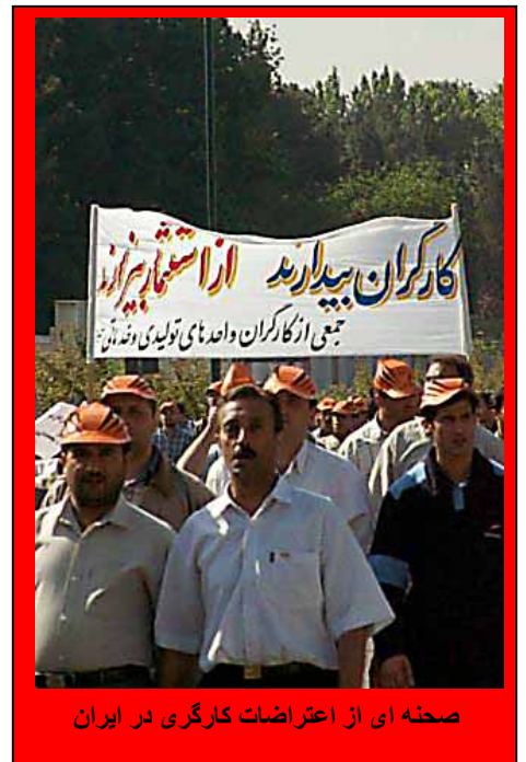
صحنه ای از اعتراضات کارگری در ایران

از اوایل خرداد ماه بیش از ۵ هزار تن از کارگران زحمتکش نیشکر هفت تپه که از آغاز سال جاری هیچ حقوقی دریافت نکرده اند، با مشاهده عدم رسیدگی مسئولین کارخانه به خواسته‌های برحقشان دست از کار کشیده و خواهان دریافت حقوق عقب افتاده و رسیدگی به سایر خواسته‌های خویش شدند. کارگران این شرکت در طول ۲ سال گذشته یازده بار دست به اعتراض و اعتصاب زده اند و اعتصاب کنونی در شرایطی به وقوع می پیوندد که کارگران بین ۲ تا ۴ ماه است که حقوقهای خود را دریافت نکرده و برای تامین نان شب خانواده و سایر نیازهای ابتدائی زندگی خویش شدیداً تحت فشار قرار گرفته اند.