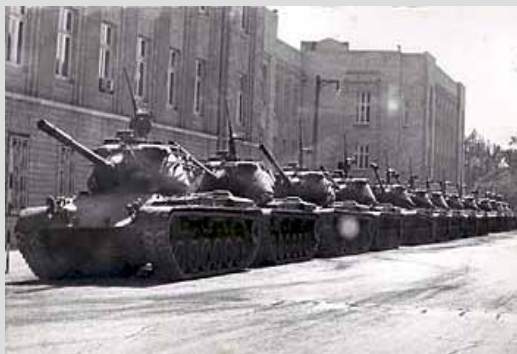
صحنه ای از کودتای امپریالیستی ۲۸ مرداد سال ۱۳۳۲

۲۸ مرداد سالگرد کودتای ننگین امپریالیستی بر علیه دولت ملی مصدق و توده‌های تحت ستم ایران است. ۵۴ سال پیش در چنین روزی ارتش سیا ساخته با کودتایی که اربابان شاه مزدور در آمریکا طراحی کرده بودند. دولت ملی دکتر مصدق را سرنگون نموده و مزدور سرسپرده خویش یعنی شاه فراری را به قدرت بازگرداندند. این کودتا سر آغاز یکی از سیاهترین دوره‌های زندگی مردم زحمتکش ما بود. که سرانجام با رشد مبارزه و با پاکبازی جنبش مسلحانه و با فداکاریهای ارزنده نسلی از پاکبازانه ترین فرزندان خلقهای تحت ستم ایران یعنی چریکهای فدایی و مجاهدین خلق پاسخ شایسته گرفت. در سالگرد این جنایت بزرگ بکشیم تا با شعار مرگ بر امپریالیسم و رژیم وابسته به امپریالیسم جمهوری اسلامی! زنده باد انقلاب! زنده باد کمونیسم! یاد تمامی توده‌های مبارز و آگاه که در جریان این کودتای ضد خلقی جان باختند را با تداوم مبارزه بر علیه سلطه ضد خلقی امپریالیسم و سگان زنجیرش در ایران پاس داریم!