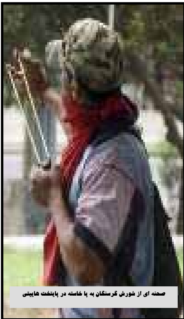
صحنه ای از شورش گرسنگان به پا خاسته در پایتخت هائیتی