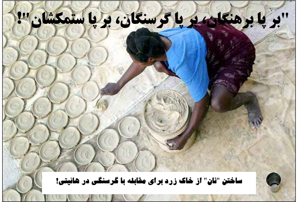
ساختن "نان" از خاک زرد برای مقابله با گرسنگی در هائیتی!

حداقل ۵ نفر جان باختند. در هائیتی شورش مردم گرسنه ای که از فرط بی غذایی به خوردن خاک روی آورده اند از چنان شدت و وسعتی بر خوردار بود که در پی خود باعث سقوط هیئت دولت شد.