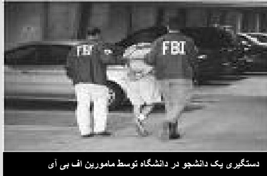
دستگیری یک دانشجو در دانشگاه توسط مامورین اف بی آی

دمکراتیک شهروندان امریکایی انجام دهد. در چنین شرایطی است که دولت امریکا قصد دارد که ترس از تفکر و تفحص (و اینکه هر سوال و بحث علمی هم می تواند بعنوان مولفه شناسایی جاسوس و تروریست بحساب آید) را حتی در محیط دانشگاه ها نیز رشد داده و هر اعتراض و مقاومتی را در داخل این کشور از بین ببرد.