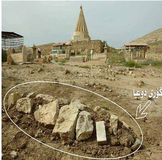
محل دفن "دوما" دختر جوان کرد که سال گذشته در یک اقدام وحشیانه در کردستان عراق سنگسار شد!