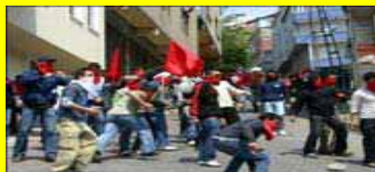
سرکوب وحشیانه تظاهرات روز جهانی کارگر ۲۰۰۸ در ترکیه و مقاومت توده‌ها! (صفحه ۲۴)