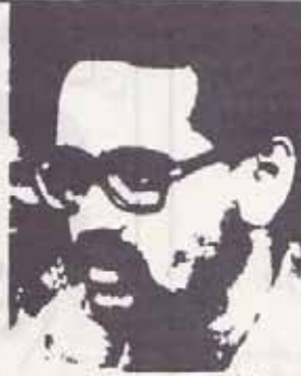
فدائی شهید رئیس هیئت مدیره و دبیر هیئت مدیره