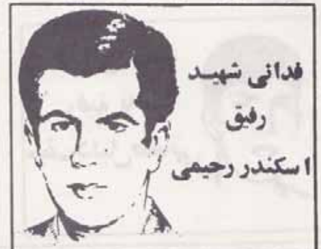
فدائی شهید رفیق اسکندر رحیمی

شده و وحدت فقدان سیاست اصولی در حل بحران دچار انشعابات متعدد شده ، اما نهرهای پیرو و برنامه (هویت) یاد رک ضروریات این مرحله از جنبش انقلابی موهب ما و با تحلیل درست از بحران کنونی جنبش کمونیستی سال گذشته توانسته اند با تلاش و جانفشانی بسیاری از کادرها و اصلا سازمان در داخل و خارج از کشور خود را سازمان داد مبتدع جای واقعی خود را در مبارزه می- بابتند . سازمان چریکهای فدائی خلق ایران پیرو برنامه (هویت) مصمم است از خون هزاران شهید بخون حفته خلق ، بحاضر پاسداری از ارزش‌ها و سنن انقلابی رفتگان سهاکل در جهت اهدا