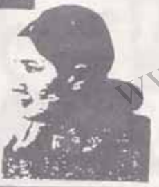
★ رفیق فدائی نزهت السادات روحی آهنگران