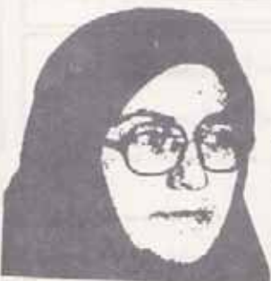
★ مجاهد قهرمان اشرف ربیعی

رسیدن اهداف فوق ویران نیات صهیونیستار جنگال رژیم ددمشرجام در تدارت پیام ضدجانه خلق سرشعدال نمایند و سرانجام مامعتمدیم در پس تمام ابرهای تیره و تاریک ارتجاع مبرون و سحانی و در پس رنگ و ولعابهای ظاهر فریب فرهنگ امپریالیستی، ستاره صبح خواهد دیند و طلوع خورشید، رهائی تمام زنان و مردان رانهد میدهد. از این جهت زنان مبارز مبین ما باید در جهت تسویه شخصی خود به انسانهای نجیب و اعدا آزاد، مستقل و مسئول کوشش نمود. میا هر گونه تفکریسیستی و تسلیم عدلیانه مبارزه نتند. ما به همه زنانی که در زندانهای رژیم ارتجاعی خمینی مقاومت میکنند افتخار میزنیم. ما به همه زنان مبینمان که در یخکارهای عظیم کوشش جان خود را از دست میدهند و شهادت میرسد احتسار میزنیم به همه مادرانی که فرزندان و زنانیکه شوهران پاک باخته خود را در این مبارزه سرنگ از خاکت بر میانند و خود میفرستند به عظیم خرد گدشگری آنها را در کوره و جادو چینی مادرانسی بر خود میبایم. ما به همه زنان انقلابی که دست در دست مردان به مبارزه مسلحانه افتخار میزنیم و بیشتر خود آورد و در صفوف پیشمرگان مهربانان و مملتیهای رزمند و پیرشهای فدائی خلق مبارزه مسلحانه میزنند و با اشتغال دیگر مبارزه میزنند مبارزه را نهیتم می کنند افتخار میزنیم. ما حاضریم این جایز بها و دانا بهای قلبیه زنان فدائیکه در یخکار برای رهائی، دمکراسی، صلح و سوسیالیسم مبارزه میکنند شهادت میرسد گرامی میداریم.