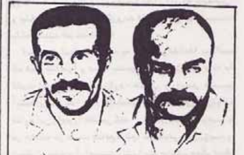
بیباد رفقای فدائی

بمناسبت دهه فجر مراسمی شامل مسابقه دو میدانی دانش آموزان از طرف رژیم ارتجاعی خمینی در تاریخ ۱۸ بهمن اعلام میشود. طبق برنامه این مسابقات از امجدیه شروع و به بلوار کشاورز خاتمه می‌یابند و سپس بالاجبار به نماز جمعه برده میشوند. تسد زبانی از دانش آموزان جهت شرکت و تماشاگران مسابقه بقیه در صفحه ۶