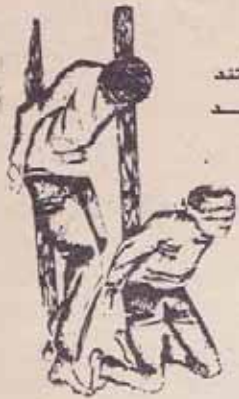
در برابر تنه می ایستند خانه را روشن می کنند و می میرند.