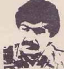
فدایی شهید موسی خیابانی

۱۳۶۱/۱۱/۶ - حمله مزدوران رژیم خمینی به سه روستای کلر شاخان، سورجان و پویوی هم کوهستان ایران و قتل عام اهالی این روستاها