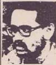
فدایی شهید رفیق نوما

۱۳۵۷/۱۱/۳۰ - گشایش سفارت انقلاب فلسطین در محل سابق سفارت اسرائیل ۱۳۵۸/۱۱/۱۹ - تحمیل جنگه دوم به خلق ترکمن از طرف رژیم خمینی