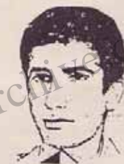
امیر شهید - رفیق رحیم ستاری

روزنامه جمهوری اسلامی ۲۱ دی ۶۸، برخی دست های مشکوک بکار افتاده اند تا زمینه های وحدت در جامعه را خدشه دار کنند و برای این کار، از قسم شروع کرده اند. ساده اندیشان به لحاظ جوهره وجودشان مازهم در ذهن محدود خود که از القای شبهه دیگران هم معون نبوده و نیست، همان تلقی های سطحی و ساده اندیشانه را مرور می کنند. به ساده اندیشان و آنچه در ذهن آنها می گذرد، حرجی نیست ولی اگر انعکاس آن احیانا خطری را متوجه وحدت صفوف جامعه کند، دیگر نباید از کنار آن سادگی گذشت. واکنش مسئولان مردم قم که همواره پیشتر نسبت بوده اند، دقیقا همین مفهوم را تداعی می کند.