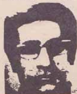
فدایی شهید قاسم سیادتی

۱۳۵۷/۱۱/۲۲ - در جریان قتل مسلحانه مردم تهران، فدایی خلق بابک سلایی در حمله به یادگان ششرت آباد فدایی خلق خسرو پناهی در حمله به کلانتری ۶ تهران فدایی خلق محمد علی ملکوتیان (یکی از چهره‌های انقلابی زندانیان رژیم شاه) در حمله به یادگان جمشیدیه ونیر رفیق فدایی، قاسم سیادتی عضو مرکزیت سازمان چریک‌های فدایی خلق ایران در جریان فتح مرکز رادیو ایران، شهادت رسیدند.