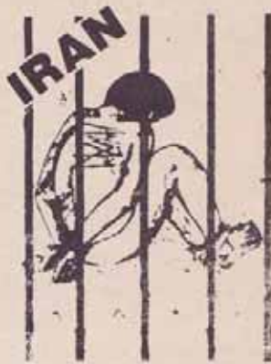
به یاری زندانیان سیاسی ایران بشنابید

دفتر مجاهدین خلق ایران - بغداد ۹ ژانویه ۹۰