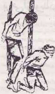
در برابر تتروریستند خانها را روشن می‌کنند و می‌کینند