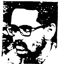
فدایی شهید رامین توماج

۱۳۵۷/۱۱/۲۰ - کنش سفارت انقلاب فلسطین در محل سابق سفارت اسرائیل ۱۳۵۸/۱۱/۱۹ - محمول جنگ دوم به خلق ترکمن از طرف رژیم خمینی