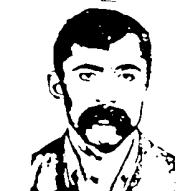
فدایی شهید رفیق سعود رحمتی

۱۳۶۱/۱۱/۶ - حمله مزدوران رژیم خمینی به روستای کلمرفاخان، سرچار و سوزی در کردستان ایران و قتل عام اهالی این روستاها ۱۳۶۱/۱۱/۲۳ - شهادت قهرمانانه و حماسی یازده تن از پیشمرگان فدایی تحت فرماندهی شهید قبرمان، رفیق فدایی سعود رحمتی طی یک درگیری خونین با مزدوران رژیم خمینی در جاده بوکان - سنقر.