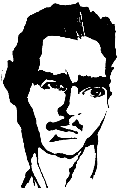
گرامی باد خاطره