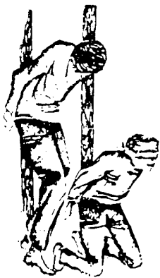
دریوایر قدر می ایستند خانه را روشن می کنند و می میزند