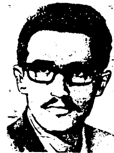
مجاهد شهید احمد رضایی

۱/۱/۱۲۵۰ - شهادت مجاهد کبیر احمد رضایی یکی از برجسته ترین کادرهای سازمان مجاهدین خلق ایران در یک درگیری حماسی بامزدوران رژیم شاه (اولین شهید مجاهد خلق)