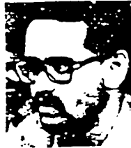
فدایی شهید رفیق توماج

۲۰/۱۱/۱۲۵۷ - گشایش سفارت انقلاب فلسطین در محل سابق سفارت اسرائیل ۱۹/۱۱/۱۲۵۸ - تحمیل جنگ دوم به خلق ترکمن از طرف رژیم خمینی