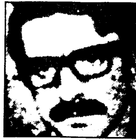
فدایی شهید حسن ضیاءظریفی