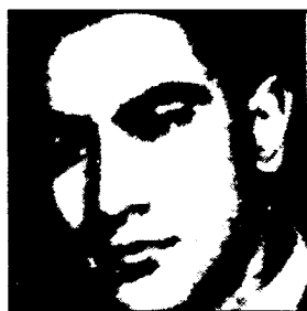
فدایی شهید عزیز سرمدی

در میان ۷ نفری که از چریکهای فدایی خلق در آن جنایت بزرگ به شهادت رسیدند، رفیق بیژن جزنی، جایی برجسته‌تر از دیگران داشت. رفیق جزنی، یک رهبر برجسته جنبش کمونیستی ایران بود تواناتپه‌ایش او را قادر می‌ساخت به یک رهبر ملی تبدیل شود. بدون شک در تاریخ جنبش کمونیستی ایران بیژن جزنی بی‌همتاست. او یک ایدئولوگ، یک استراتژیست و یک تاکتیکسین برجسته بود. او مرد عمل انقلاب بود. برای او زندگی و انقلاب، تنوری و عمل، فلسفه و شعر، مبارزه و هنر درهم آمیخته بود. بیژن در سال ۱۳۱۶ شمسی متولد شد و از ده سالگی مبارزه سیاسی را آغاز کرد. او از آن مبارزان نادری بود که در هر کجا که حرکت سیاسی و مردمی وجود داشت، در آن نقش پیشرو به عهده می‌گرفت. فعالیت سیاسی در دوران قبل از کودتای ۲۸ مرداد ۳۲، فعالیت در دوران سیاه پس از کودتا تا آغاز دهه چهل، مبارزه سیاسی در سالهای اول دهه چهل و سرانجام پایه‌ریزی یک گروه سیاسی - نظامی که در ادامه حیات خود به جنبش پیششاز فدایی تبدیل شد. بیژن بارها به زندان افتاد و هر بار با تجربیاتی غنی‌تر از گذشته، به تلاشی سترگ برای راه‌جویی عملی و نظری برای توسعه عمل انقلابی ادامه می‌داد. او از هر فرصتی و از هر امکانی برای مبارزه انقلابی سود می‌جست. استقامت و پایداری او، استواریش در مواضع ایدئولوژیک و اعتقادات عمیقش به خطوط استراتژیک مبارزه انقلابی و مسلحانه، هرگز باعث آن نشد که او از انعطافهای ضروری در عمل انقلابی