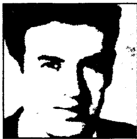
فدایی شهید مشوف کلاتری