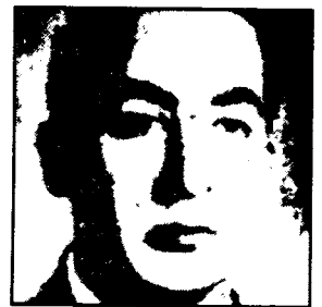
فدایی شهید احمد جلیل زاده افشار

دوری جوید. انعطاف‌پذیری، تحمل کردن عقاید دیگران و وضوح بودن در پیشبرد نظرانش و توجه به مسائل افرادی که به‌ر دلیل و تحت هر شرایطی با او به نوعی در ارتباط بودند، خصلتهای انسانی ارزشمنند این رفیق بود. او عاشق زندگی و انقلاب بود و می‌دانست که چه راه سخت و دشواری برگزیده است. او همواره می‌سوخت که این راه صعب و طولانی را باید با پیکارهای بی‌امان نزدیک کرد و خود چنین کرد و در این راه جان باخت. پس از شروع جنبش مسلحانه در ۱۹ بهمن ۱۳۴۹ بیژن شاهد رشد نهالی بود که بذرش را خود کاشته بود. او زندان را حقیقتاً به یک دانشگاه تبدیل کرد. چهار سال آخر عمرش را بی‌وقفه برای فروزان‌تر کردن مشملی که در سپاهلک روشن شده بود، گذراند. در این سالها او دهها