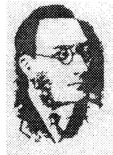
دکتر تقی ارانی