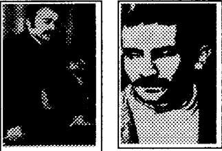
کرامت الله دانشیان خسرو گل سرخی

با یاد رفقای فدایی، خسرو گل سرخی و کرامت الله دانشیان که در سحرگاه ۲۹ بهمن ۱۳۵۲ به دست دژخیمان رژیم شاه اعدام شدند.