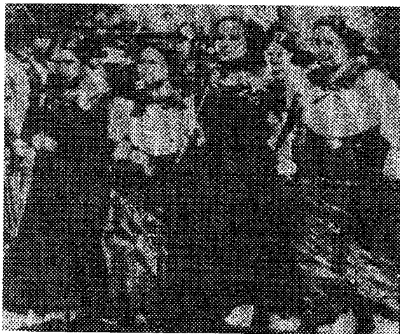
۸ مارس ۱۹۰۹، نیویورک - تظاهرات زنان برای زندگی بهتر، بهبود شرایط کار و ممنوعیت کار کودکان

آزادی سخن می گویند حال آن که اخیراً تعدادی از روزنامه های ایران تعطیل شده است. شهادت دو زن برابر یک مرد است و از دختران باید آزمایش بکارت به عمل آید. دختران را می توان در سن ۹ سالگی به عقد و ازدواج درآورد، آیا این است مفهوم آزادی؟ جواب می دهد: «در مورد زنان همان نظری که در قسمت قبل اشاره کردم یکی از تلاشهای ما بازنگری و اصلاح متن قوانین و مقررات است. البته نه همه قوانین و مقررات. به خاطر این که بعضی از قوانین جزء اعتقادات مذهبی ماست و معتقدیم که باید ثابت بماند. اما بعضی از قوانین اسلامی متناسب با شرایط قابل اصلاح و بقا هستند.» روشن است که زهرا شجاعی نمی تواند با تغییرات اساسی در قوانین اساسی که مربوط به زن است موافق باشد. چرا که هر گام اساسی به سود زنان، رژیم را صدها گام به سرنگونی اش نزدیک می کند.