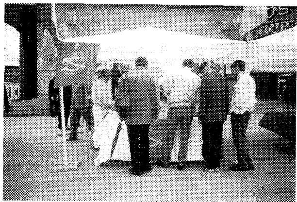
بر روی یک پلاکارد بزرگ نوشته شده بود: تحریم سراسری انتخابات ریاست جمهوری از تجماع از سوی مردم

فعلان سازمان چریکهای فدایی خلق ایران در این تظاهرات فعالانه شرکت داشتند و میز کتاب، نشریات و نوارهای سازمان مورد استقبال شرکت کنندگان قرار گرفت.