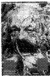
Andeesheh va Peykar Publication Postfach 600132 60331 Frankfurt - GERMANY