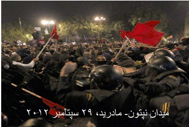
میدان نپتون - مادرید، ۲۹ سپتامبر ۲۰۱۲

۱۳: در مقابل این وضعیت بحرانی ما شاهد جنبشها و خیزشهای بسیار در کشورهای کانونی سرمایه داری بودیم. جنبش محرومان و ستمدیدگان در کشورهای پیشرفته سرمایه داری برآمد جدیدی را در سالهای گذشته به ثبت رساند. طی سه دهه گذشته، توسعه سرمایه داری نو-لیبرال و گذار آن از رابطه «پول-پول-کالا-پول» به رابطه «پول-پول» که تحلیلگران اقتصادی آن را کاپیتالیسم کازینویی می نامند،