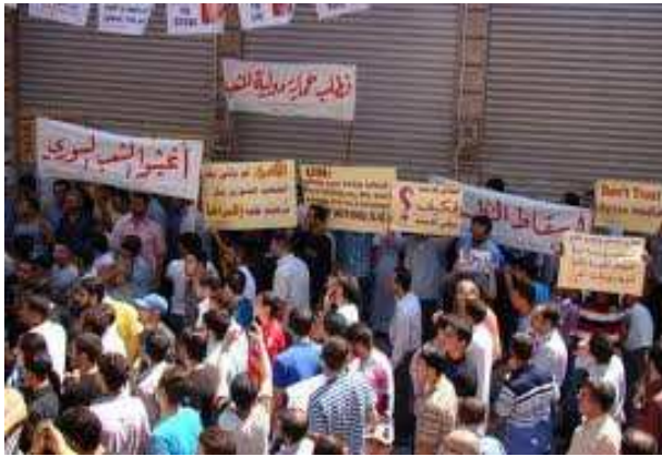
برانگیختن وجدان مردم و تجربیات انقلاب است.

ناپذیر است. اما ما به لزوم تشکیل جبهه متحد چپ سوریه نیز معتقدیم."