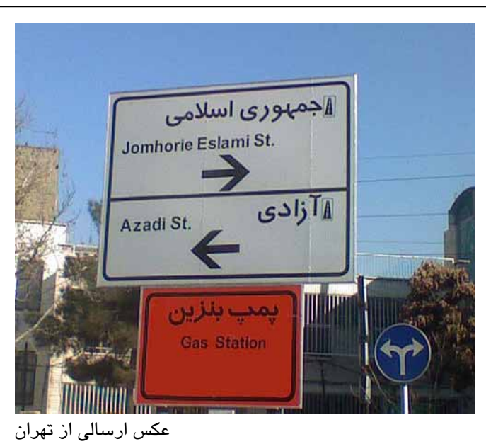
عکس ارسالی از تهران

حکومتی که در درون کشور حقوق و آزادی های اولیه مردم را لگد مال می کند، هر گونه صدای مخالفی را با زندان و شکنجه و تهدید پاسخ می گوید و پایه های قدرتش را با کشتار و اعدام و ترور مخالفان مستحکم نموده است و فقط در عرض چند ماه در سال ۶۷ هزاران نفر را در زندان های خود سر به نیست نموده است؛ این حکومت مردم ایران را از هر گونه آزادی و انتخاب آزادانه ای در مورد آینده خود محروم نموده و در سیاست خارجی نیز کارنامه ای بهتر از کارنامه داخلی اش ندارد. بعد از ۲۸ سال، شعار های مرگ بر این یا آن کشور زینت بخش تجمعات و نماز جمعه های حکومتی است. هنوز هم کشور های دنیا را به دوست و دشمن تقسیم می کند و رئیس جمهور آن از پشت تریبون های رسمی کشور خواستار محو اسرائیل است و فرماندهان نظامی آن علنا دیگران را تهدید به ترور و .. می کنند و رسماً در پشت سر جریاناتی مثل حزب الله در لبنان و حماس و غیره سنگر می گیرند.