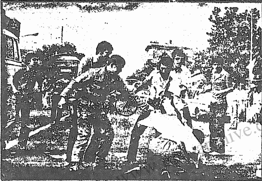
اینها که اینچنین مردم را به گلوله می‌بندند، پاسداران انقلابند یا پاسداران سرمایه و حامیان سرکوب و اختناق؟ صحنه‌ای از تظاهرات اخیر در خیابانهای تهران - چهارشنبه ۲۵ خرداد پیچ شمیران