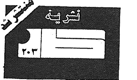
سازمان جریکهای فدایی خلق ایران

آن نیرویی که خود را در تقابل مبارزه کارگران و روستایان و سرباست حسن انقلابی بسوقل میباید سیاست در جهت افشای سیاست که برادار است در کیری با امرا میوزرد و کوشد و با آگاهگری در بین خودها، نیروی متحدان را برای شکستن عوامل بازدارنده جنبش تقویت نمایند.