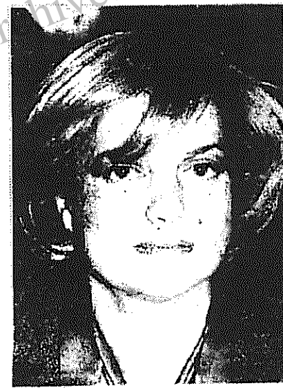
یک سیاستمدار زن ریاست دولت ترکیه را بر عهده میگیرد

خواهان حل مسالمت آمیز مسئله کردستان ترکیه شده است.