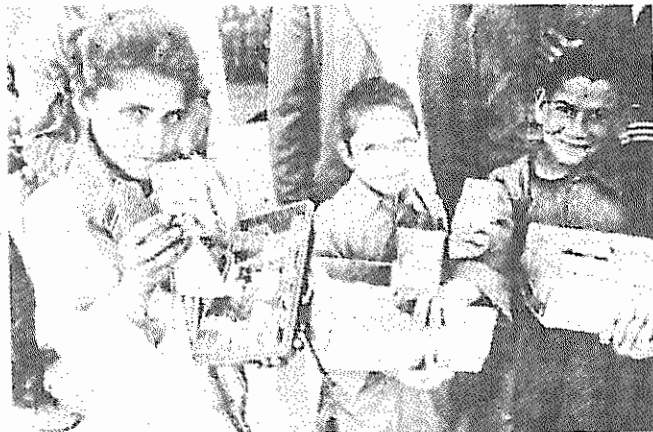
به جای نشستن در کلاسهای درس سیگار فروشی می کنند. فقر اقتصادی تلاش برای معاش را به مشکلی طاقت فرسا برای خانواده ها تبدیل کرده است

در ادامه ی تصمیمات شتابزده ای که برای مقابله با بحران اقتصادی از سوی حکومت جمهوری اسلامی اعلام می شود، هفته ی گذشته روزنامه های تهران خبر ادامه در صفحه ۱