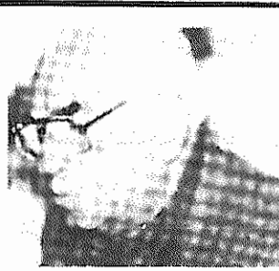
که به غنی سازی موسیقی ایرانی از طریق استفاده از موسیقی بین المللی و سازهای غربی با او داشت و در این راه تلاش و همت چشمگیری از خود نشان داد. یادش گرامی باد.

معروفی به هنگام همکاری با برنامه‌ی گلها اجراهای جاودانه‌ای را از خود برجای گذاشت. صدای پیانوی معروفی در همراهی با پیانو در اجراهایی همچون "کاروان" و "یا تا بهار دلنشین" هنوز هم دلنشین و خاطره انگیز است.