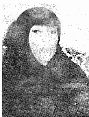
نتایج سفر بوتو

۵- خانم بوتو اظهار داشت مذاکرات در مورد نفت موضوع اصلی اش با مقامات ایرانی بوده است.