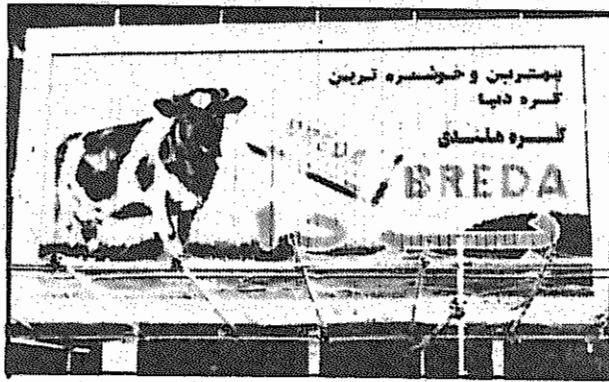
تولیدات داخلی به علت هجوم کالاهای خارجی با بحران شدیدی مواجه است و تبلیغات فراوان در دود یوارها همچنان مردم را به مصرف بیشتر کالاهای وارداتی فرامی خوانند

در کنفرانسی که اخیراً در نیویورک از سوی سازمان توسعه وابسته به سازمان ملل برای تهیه مقدمات یک پیمان صحراها و کویرها برگزار شد، مسئله پیشروی صحاری و کویرها و خطرات آن برای محیط زیست مورد بحث و گفتگو قرار گرفت. رئیس سازمان توسعه هشدار داد که اگر صحراها در ابعاد کنونی گسترش یابند، یک تراژدی بی سابقه جهانی روی خواهد داد. بر اساس داده های سازمان ملل در حال حاضر یک ششم جمعیت جهان در معرض تأثیرات صحرا گسری قرار دارد. روند خشک شدن دشت ها هم اینک یک چهارم سطح زمین را تهدید می کند و نهمصد میلیون نفر روی کمر بند خشک زمین زندگی می کنند. گسترش صحراها بیش از همه به آفریقا آسیب وارد آورده است. ۷۳ درصد زمین های زراعی این قاره از این رو هگدر صدمه دیده اند. این میزان در آسیایه ۷۰ درصد می رسد. در ایران نیز بعنوان یک کشور آسیایی، ابعاد صحراها و کویرها و گسترش شتابان آنها چشمگیر و مخاطره انگیز است. بر طبق آمارهای رسمی ۳۴۰ هزار کیلومتر مربع از خاک کشور را اراضی بیابانی تشکیل می دهند و ۱۶۰ هزار کیلومتر مربع آن نیز جزو مراتع مخروبه کویری به حساب می آید. به عبارت دیگر هم اکنون نزدیک به یک سوم مساحت ایران را کویرها و اراضی غیر مرتع در بر گرفته اند. علاوه بر آن اگر میزان تکان دهنده فرسایش سالانه خاک و روند گسترش صحراها در میهن مان را پیش چشم آوریم، به ابعاد خطرات سهمناکی که فاجعه صحرا گسری در ایران به بار آورده، می آورد بیشتر واقف خواهیم شد. آمار نشان می دهد که میزان فرسایش خاک در ایران ۲ میلیارد تن (یعنی دو برابر میزان متوسط در جهان) در سال می باشد. بدینسان هر روز و هر سال زمین های بیشتری در ایران از بارآوری ساقط شده و تا مین مواد غذایی لازم برای اهالی و حفاظت از محیط زیست به دشواری غامض تری