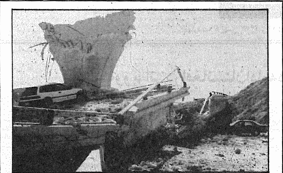
در زلزله ای به قدرت ۶.۶ ریشتر، بخش بزرگی از جنوب ایالت کالیفرنیا آمریکا، از جمله شهر لوس آنجلس، صدمه دید. طبق آمار رسمی، بیش از ۵۰ نفر کشته و ۱۵ هزار نفر بی خانمان شدند. خسارات وارده، هفت میلیارد دلار برآورد می شود. گزارشهای اولیه حاکی از مجروح شدن بیش از ۳۰ تن از هموطنان ایرانی در جریان این حادثه است. عکس پل مستقر بر یکی از بزرگراههای لوس آنجلس را نشان می دهد که از میان به دو نیم شده است.

جسارت در اجرای اصلاحات اقتصادی نماید، تقدیر کرد و افزود استدلالات و انگیزه هایی که حیدر را بر آن داشته است که استعفا کند، درک می کند. حیدر در بیانیه خود از سیاست های تخصیص بودجه دولت انتقاد کرده و خاطر نشان ساخته بود تضمینی برای به کرسی نشاندن اصلاحات ندارد. "انتخاب روسیه" در اعلامیه ای که در پارلمان خوانده شد، اشاره کرده است "تصمیمات اقتصادی خطرناکی که می تواند منجر به بی ثباتی سیاسی گردد در پیش است. این اعلامیه می افزاید تصمیمات مزبور قرار است بدون توافق با جناح "اصلاح طلب" دولت اتخاذ شود، و از این رو استعفای دوزیر کابینه که عضو "انتخاب روسیه" اند، اجتناب ناپذیر است. علاوه بر حیدر که معاونت اول نخست وزیر و وزارت اقتصاد را بر عهده داشت، باریس فیودوروف وزیر دارایی نیز روز ۲۸ دیماه اعلام کرد در کابینه جدید شرکت نخواهد کرد. یک روز قبل از آن، چرنومیردین نخست وزیر سمت وزارت دارایی را به فیودوروف پیشنهاد کرده بود، بدون اینکه آزوی برای حفظ سمت فعلی اش به عنوان معاون نخست وزیر دعوت کند. فیودوروف ماندن خود را در دولت، منوط به برکناری ویکتور گراشچنکو رئیس بانک مرکزی و الکساندر ساوروخا معاون نخست وزیر کرده بود. همچنین الا پامفیلووا وزیر امور اجتماعی نیز همراه با حیدر و فیودوروف استعفا داد و این اقدام خود را گامی از سرنویدی خواند. با استعفای سه وزیر عضو "انتخاب روسیه"، از این بلوک تنها آنا تولی، چوبایس وزیر امور خصوصی سازی در دولت باقی مانده است. چرنومیردین نخست وزیر روسیه یک روز قبل از معرفی کابینه جدید خود، در برابر انتقادات اصلاح طلبان رادیکال گفت: دوران شیفتگی به اقتصاد و بازار آزاد همکاری سازنده ای داشته باشد.