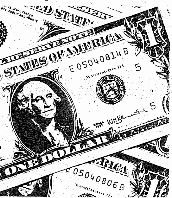
فارغ از فریادهای "مرگ بر آمریکا"ی حزب اله، زندگی در ایران هر روز بیشتر دلاری می شود

بودجه سال آینده بنا به گفته نمایندگان مجلس از افزایش بیش از ۵۰ درصد نسبت به بودجه سال ۷۲ برخوردار است. مطابق پیش بینی، ۵۸ درصد درآمدها از محل فروش نفت و مابقی از طریق مالیات و صادرات غیر نفتی تامین خواهد شد. اما با خوش بینانه ترین ارزیابی ها نیز این پیش بینی ها محقق نخواهد شد و دولت ناگزیر است برای تامین کسری بودجه به سیستم استقراض بانکی متوسل شود و چنین نیز کرده است. آنچه که در بودجه سال ۷۳ تسهیلات بانکی نام گرفته و رقم قابل ملاحظه ای را نیز تشکیل می دهد چیزی جز استقراض از بانک و به بیان روشن تر چاب بدون پشتوانه پول توسط دولت نیست. با این کار اگر چه شاید دولت موفق شود قدری از التهاب اوضاع بکاهد و امروز مهار