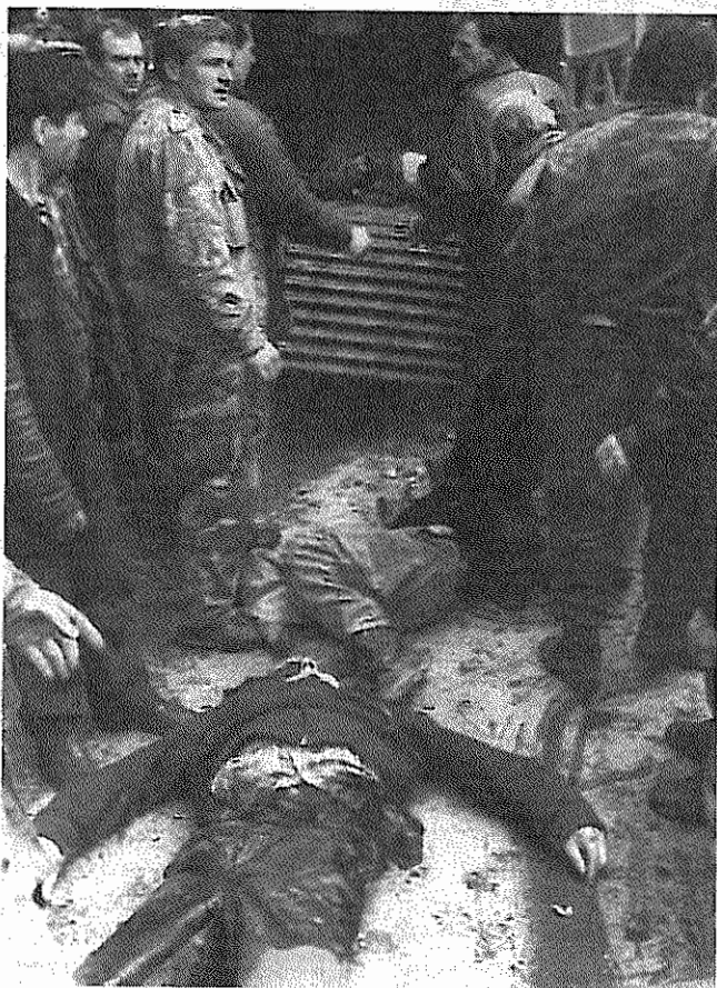
صحنه‌ای از کشتارهای روزمره در ساریوو

ادامه از صفحه ۱۲ "شل روکار رهبر حزب سوسیالیست پس از انتخاب روبرت اوبه رهبری حزب کمونیست، با ارسال پیام برادرانه‌ای برای وی اظهار امیدواری کرد که حزب کمونیست به مثابه بخشی از جنبش