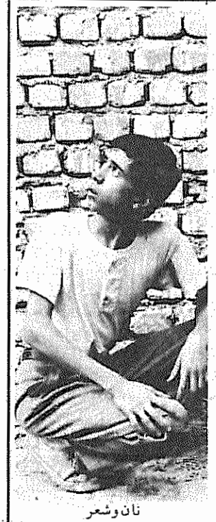
نان و شعر