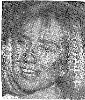
تا مین مخارج مبارزات انتخاباتی خود غارت کرده اند.

امروز پرونده مالیاتی این مورد، در برده ایام است. یک سال بعد، مک دوگال اقدام به خرید یک بانک کوچک محلی کرد. از آنجا که دولت ریگان مقررات سخت گیرانه شامل صندوق های پس انداز کوچک را سهل تر کرد، مک دوگال توانست حجم اعتبارات بانک خود را به میزان زیادی افزایش دهد. در حالی که هیات نظارت بر بانکهای آرکانزاس در سال ۱۹۸۳ کلیتون را از موقعیت منزلق معاملات بانک دو مستش آگاه کرد، فرماندار به حمایت از مک دوگال ادامه داد و حتی در سال ۱۹۸۴ از او خواست به کارزار انتخاباتی دمکراتها کمک مالی کند. در چهارم آوریل ۱۹۸۴، مک دوگال افراد سرشناس را به یک میهمانی دعوت کرد که در آن، ۳۵ هزار دلار به نفع مبارزه انتخاباتی کلیتون جمع آوری شد. نکته مشوک این است که برخی از کسانی که نام آنها روی چک ها نوشته شده است، امروز مدعی اند که هرگز چنین پولی نپرداخته اند. اکنون این ظن ابراز می شود که دمکرات های آرکانزاس، بانک مک دوگال را که در آستانه ورشکستگی بود، برای