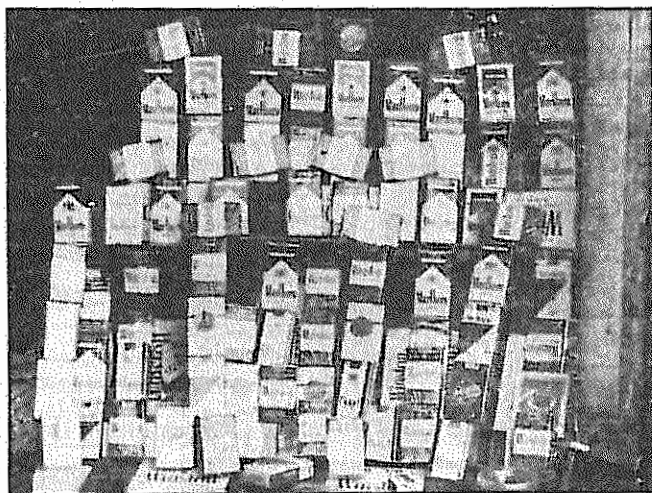
انواع مختلف سیگار خارجی را در این مغازه کوچک می توان پیدا کرد.

در چند سال اخیر همزمان با سیل ورود کالا های خارجی به کشور، راه ورود سیگارهای خارجی نیز به بازار ایران باز شده و خرید و فروش انواع سیگارهای خارجی که بیشترین آنها غیر مجاز و بصورت قاچاق وارد کشور می شوند، به کسب و کار پر رونق و سود آوری تبدیل شده است. سود آوری این کار در شرایط وجود بیکاری وسیع و پائین بودن سطح درآمدها، موجب جذب شمار زیادی از مردم در قالب شرکت ها و شبکه های متعددی در واردات و خرید و فروش سیگار خارجی شده است. کسب و کار معاملات سیگار تا بد آنجا رونق گرفته که شرکتها و شبکه های فعال در این کار، در صدد گسترش فعالیت خود به کشورهای آسیای میانه از طریق ایران هستند.