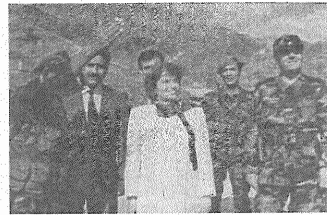
خانم چیلدر گوش شنوایی برای حرف های نظامیان دارد

در این انتخابات، کاندیدای اف. ام. ال. ان. و جریان سوسیال دمکراتیک ام. ان. از برای ریاست جمهوری السالوادور، روین زامورا بود. زامورا تا اوخر دهه هفتاد میلادی عضو حزب دمکرات مسیحی السالوادور بود، و هنگامی که حوزه ناپلئون دوارته رئیس جمهور دمکرات مسیحی وقت، برای حفظ قدرت خود در یک دوره از سرکوب شدید نیروهای چپ با نظامیان السالوادور همدست شد، زامورا به اپوزیسیون چپ پیوست و تا اوخر دوره جنگ داخلی السالوادور در خارج از این کشور در تبعید به سر می برد. نامزد حزب حاکم دست راستی "آرنا" برای احراز مقام ریاست جمهوری، آرماندو کالدرون سول، شهردار سان سالوادور پایتخت السالوادور بود. نظر خواهی های پیش از انتخابات، نشان می داد که "آرنا" با فاصله ای قابل توجه، آمارو به کاش، پرنفوذترین نیروی سیاسی السالوادور است. این حزب برای آنکه در انتخابات پیروز شود و در همان مرحله اول، کاندیدای خود را با احراز اکثریت مطلق، به ریاست جمهوری برساند، به فعالیت گسترده ای دست زد. به عنوان نمونه، آرنا در سراسر سان سالوادور اعلامیه هایی پخش کرد که روین