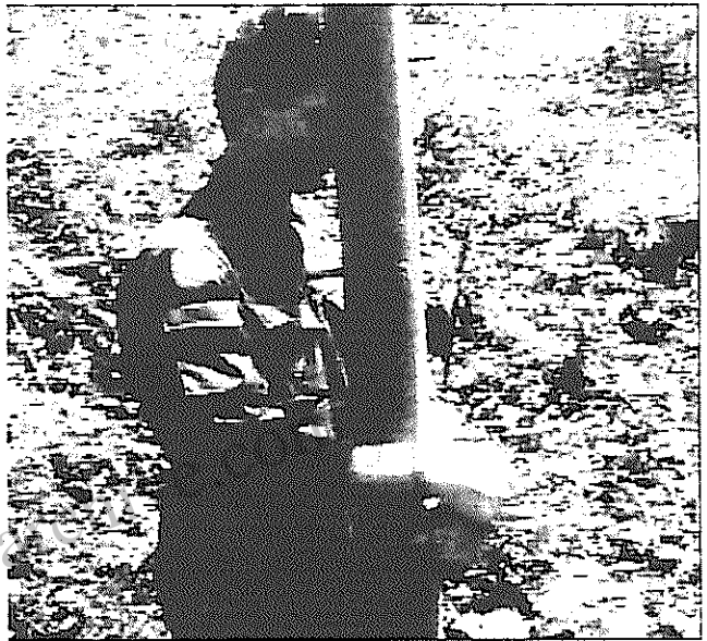
یک سرباز سازمان ملل که به دست صرب ها اسیر شده است

این حمله نه تنها به عقب نشینی صرب ها نیا نجامید، بلکه آنها را