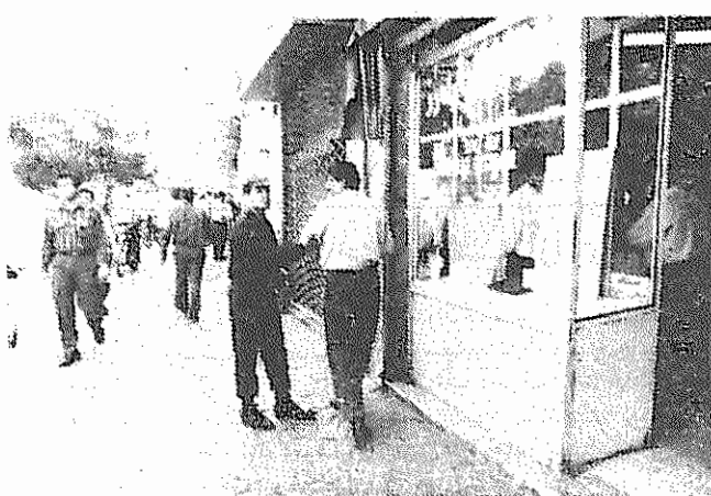
بازار آزاد ارز فعلاً دچار رکود است و صرافها و دلان منتظره؛ تأمر تصمیمات جدید دولت چقدر پاید

۶ سال پس از دوری از اقتصاد جنگی، بحران اقتصادی رفته رفته دولت و حکومت را به چنان گردابی کشاند که ناگزیر چاره کار خود را در بازگشت دوباره به اقتصاد بسته سالهای قبل دیدند. سیاست تعدیل اقتصادی در همه جهات آن، از جمله یکنان سازی نرخ ارز و شناور کردن آن و رویکرد به اقتصاد بازار ساز و کار عرضه و تقاضا، یکی پس از دیگری به کنار گذاشته شد و دولت بار دیگر کنترل امور مربوط به مبادلات ارزی و بازار گانی خارجی را به عهده گرفت. آخرین تصمیم دولت آغاز دور باطل دیگری در راهبری اقتصاد در هم شکسته ایران توسط رژیم جمهوری اسلامی است. بنابه آخرین تصمیم دولت که از روز ۱۳ اردیبهشت (۲۱ مه) به اجرا گذاشته شده است، مبادلات ارزی از این پس از طریق شبکه بانکی و بر اساس نرخ اعلام شده از سوی دولت انجام خواهد شد. نرخ تعیین شده برای هر دلار آمریکا ۳۰۰ تومان است که تا پایان سال ۷۴ ثابت خواهد ماند. خرید و فروش ارز بقیه از صفحه ۳