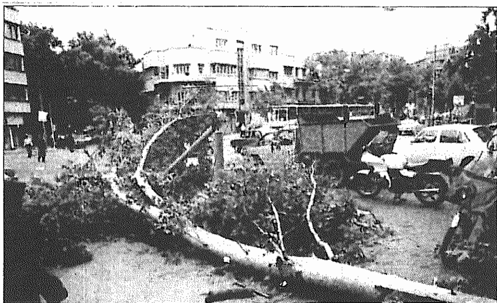
توفان و سیل در تهران درختان را از جای کند، چندین قربانی گرفت و خسارات زیادی به بار آورد

یکی از عوامل موثر در گسترش ابعاد خسارت جانی و مالی مردم مناطق سیل زده فقدان سدهای مناسب برای مهار و انحراف مسیر آب است.