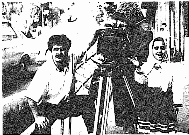
جعفر پناهی و آیلا محمد خانی دخترک فیلم که بازی درخشانی ارائه داد، در صحنه یادکنک سفید

غیرگیشه‌ای سال گذشته سینمای ایران بود که در آن جعفر پناهی فیلمنامه‌ی شخصی و خاص کیارستمی را با زبانی ساده، ملموس و شاعرانه به تصویر کشیده است. در آن همان حکایات و حساسیت‌های کودکی که معمولا فیلم‌های کیارستمی است با آفرینشی بدیع و واقع‌گرایانه به نمایش درآمده و داستانی بسیار ساده به فیلمی جذاب بدل گشته است. داستان فیلم به تحویل سال نورمربوط است. دختری با اسکناسی بانصد تومانی از خانه خارج می‌شود تا ماهی‌ای صد تومانی بخرد و اسکناس را گم می‌کند، تمام ماجرا از همین جا شکل می‌گیرد و پرسوناژهای فرعی هر یک در شکل بخشیدن به فیلم نقشی اساسی دارند.