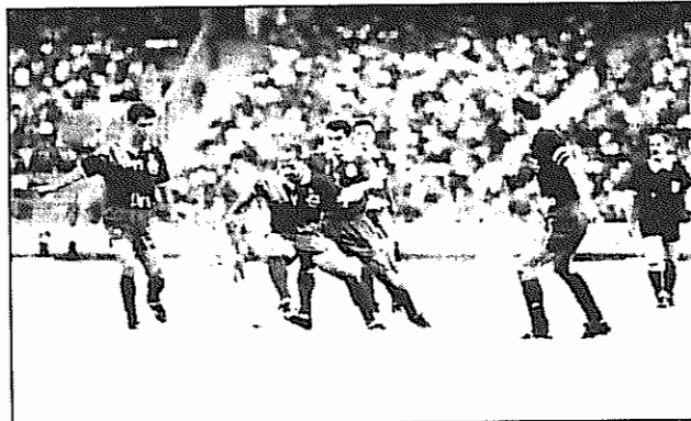
صحنه ای از مسابقات هفته دوم لیگ سراسری فوتبال

مسابقات فوتبال لیگ سراسری ایران (جام آزادگان) با دیدار آزارات تهران و پللی اکریل اصفهان افتتاح شد. این دوره از مسابقات جام آزادگان در یک گروه ۱۶ تیمی به صورت دوره‌ای برگزار می‌شود. در پایان دیدار دو تیم به تساوی دو بر دو رضایت دادند. استقلال تهران با یک گل در مقابل برق شیراز شکست خورد. بهمن تهران در اهواز استقلال اهواز را با نتیجه ۴ بر یک شکست داد. در تبریز دو تیم تبریزی شهرداری و ماشین سازی بدون گل امتیاز بازی را تقسیم کردند. در تهران پیروزی و سایا دو تیم پایتخت نشین پیروزی هم قرار گرفتند. پیروزی توانست این دیدار را با نتیجه ۳ بر یک به سود خود پایان بخشد. در انزلی ملوان این شهر با جنوب اهواز به تساوی بدون گل رسید. کشاورز تهران با یک گل از سد میهمان خود شمشک نوشهر گذشت. سپاهان اصفهان با سه گل