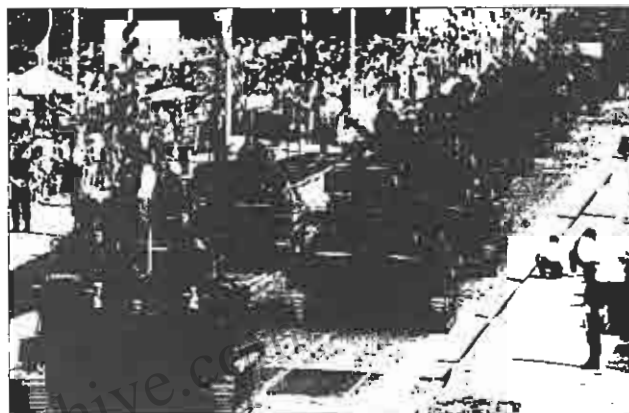
قدرت نمایی نیروهای کروات

جنگ سه ساله بالکان که به عرصه رقابت و زور آزمایی غرب با روسیه از یک سو و آمریکا و آلمان با فرانسه و انگلیس از سوی دیگر تبدیل شده است، به دلیل امتناع صرب‌ها از پذیرش طرح صلح گروه تماس، منشکل از نمایندگان انگلیس، آلمان، فرانسه، روسیه و آمریکا، کماکان ادامه یافته است. طرح گروه تماس، ۵۱ درصد خاک بوسنی هرزه گوین را به مسلمان‌ها و کروات‌ها و ۴۹ درصد بقیه را در اختیار صرب‌ها قرار می‌دهد. بوسنی هرزه گوین با مساحتی بیش از ۵۱ هزار و ۹۲۱ کیلومتر مربع و جمعیتی حدود ۴/۴ میلیون نفر، از جمهوری‌های مهم تشکیل دهنده یوگسلاوی سابق به شمار می‌رفت. در این جمهوری ۴۴ درصد مسلمان، ۳۱ درصد صرب و ۱۷ درصد کروات زندگی می‌کنند.