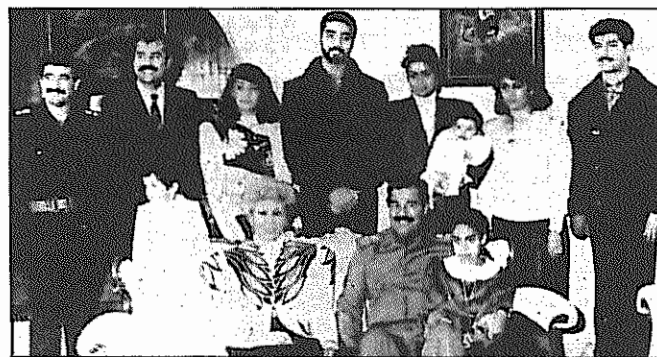
صدام حسین در کنار اعضای خانواده خود. بسیاری از این افراد به اردن گریختند و در دسربرگی رابرای دیکتاتور عراق ایجاد کردند.

پدیده جدید در این تحولات، موضع گیری تند اردن علیه عراق است. دولت اردن که در جریان جنگ کویت بر خلاف اکثر کشورهای عربی مناسبات نزدیک خود را با عراق حفظ کرد، اینک در یک چرخش آشکار با سیاست آمریکا