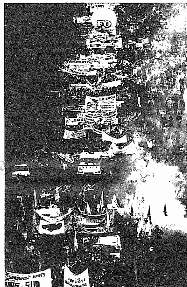
صدها هزار نفر از مردم فرانسه خواهان لغو برنامه‌های «رفرم اجتماعی» دولت دست راستی فرانسه شدند

رهبر اصلی موج اعتراضی فرانسوی‌ها سندیگاهای کارگری، به ویژه CGT و FO، دو سندیگای بزرگ‌ترین و پرنفوذترین سندیگاهای کشور بودند. این دو سندیگاهای همواره بر مقاومت تا به آخر در برابر رفرم اجتماعی با فشاری کرده‌اند. احزاب سوسیالیست و کمونیست از اعتصاب‌ها و اعتراضات پشتیبانی کردند. این اقدامات هم‌چنین مورد پشتیبانی سندیگاهای کارگری دیگر کشورهای اروپائی نیز قرار گرفت. در جریان اعتصاب برخی روزها طول مجموعه راه‌بندان‌ها در پاریس و حومه آن به بیش از ۳۱۰ کیلومتر رسید. فروشگاهها تا ۸۰٪ فروش داشتند و سود بردند. هر روز و به ویژه در روزهای فراخوان عمومی هزاران هزار فرانسوی در خیابانهای تمامی شهرهای کشور به ویژه شهرهای بزرگ به راه می‌افتادند و از دولت ژوپه پس گرفتن طرح رفرم اجتماعی و طرح تسغیر ساختار راه آهن را می‌خواستند. در جریان این درگیریها چندین تن زخمی و عده‌ای نیز با زداشت شدند. در روز سه‌شنبه ۱۲ دسامبر تعداد شرکت‌کنندگان در راه‌پیمایی‌ها به بالاترین حد خود رسید. در این روز در سرتاسر کشور بیش از یک میلیون فرانسوی به فراخوان