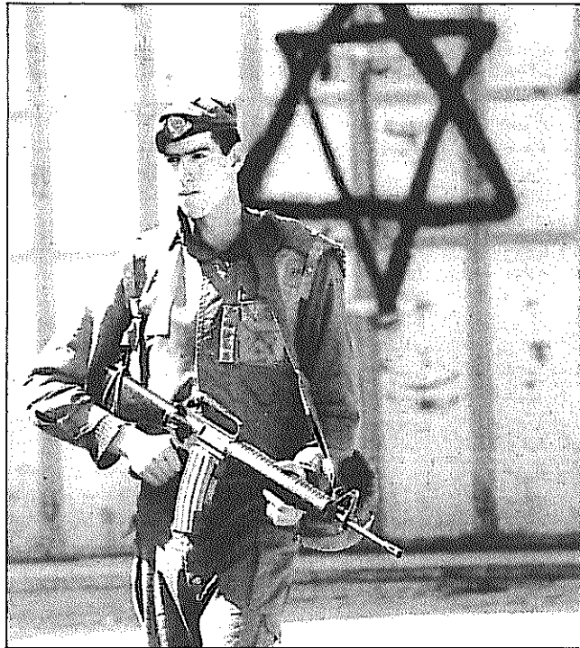
تقویت اقدامات امنیتی در شهر هیرون یکی از اقداماتی است که دولت اسرائیل به بهانه مقابل بیشتر با تروریست‌ها به آن دست زده است. عکس یک سرباز اسرائیلی را در حین کنترل ورودی بازار مرکزی تصویر می‌کند.