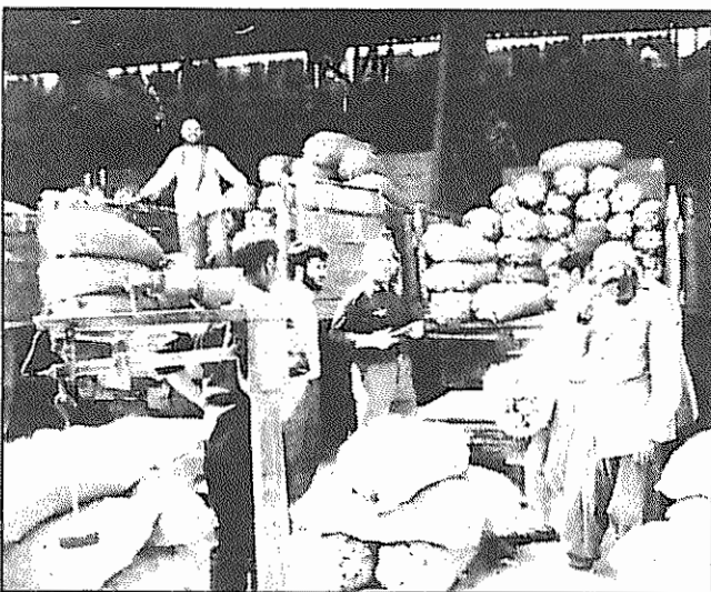
قیمت پیاز و سیب زمینی در اکثر شهرها به شدت افزایش یافت

دولت بهای هر لیتر بنزین سوپر با ۴۰ ریال افزایش، به ۱۸۰ ریال رسید و قرار شد از اول سال جاری هر لیتر روغن فله الوند ۸۰۰ ریال فروخته شود. پیش از تغییرات اخیر قیمت هر یک لیتر روغن ۲۲۵ ریال بود. غلایرضا آقازاده، وزیر نفت در مصاحبه مطبوعاتی از افزایش بهای نفت حمایت کرد و اظهار داشت که هدف دولت از افزایش بهای فرآورده‌های نفتی، کاهش مصرف داخلی و صرفه‌جویی در هزینه‌ها است. بنا به گفته وی دولت در سال ۷۴ از طریق دو برابر کردن بهای بنزین و نفت، یک میلیارد و ۶۰۰ میلیون دلار صرفه‌جویی کرده است. وی توضیح نداد این مبلغ کلان در کدام بخش هزینه و یا سرمایه‌گذاری شده است. بر اساس تبصره ۱۹ برنامه پنج ساله دوم، به دولت اجازه داده شده است به منظور اعمال سیاست صرفه‌جویی در مصرف انرژی، از سال ۷۵ قیمت فرآورده‌های نفتی را تا سطحی افزایش دهد که مجموع