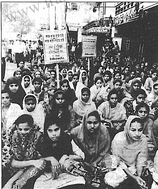
اعتراض آرام به ناآرامی‌ها: کارگران یک کارخانه پارچه‌بافی در داکا با تظاهرات تشنه جلوی کارخانه، به ناآرامی‌های بنگلادش اعتراض می‌کنند.

اما اپوزیسیون اعلام کرد که چنین قانون مهمی را از یک پارلمان دست‌نشانده تحت رهبری یک نخست‌وزیر غیر قانونی نمی‌تواند بپذیرد و خواستار برکناری خالد ضیاء و لغو نتایج انتخابات ۲۶ فوریه شد. بالاخره بعد از سه هفته اعتصابات و درگیریها هفته گذشته خالد ضیاء از نخست‌وزیری استعفا داد و رئیس‌جمهور یسوراس، قاضی عالی بنام هابی‌بور رحمان را به عنوان مسئول دولت بیطرف معرفی کرد. انتخابات آزاد بسایستی تا ماه مه برگزار شود. اپوزیسیون بنگلادش که از