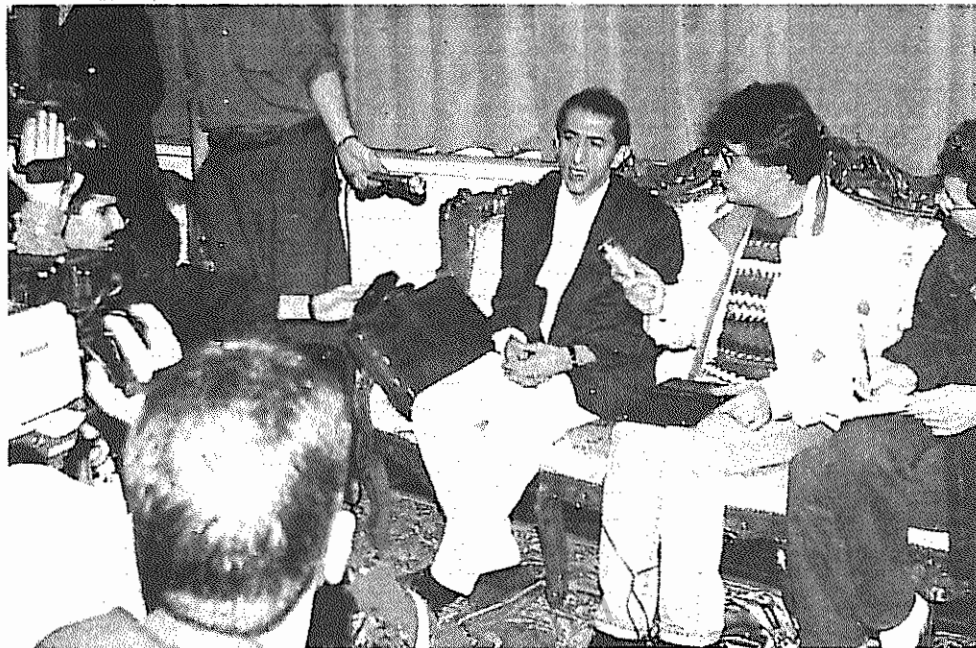
جمعه ۳۰ آذر. سرکوهی با چهره‌های تکیه‌دار کنفرانس مطبوعاتی فرودگاه مهرآباد