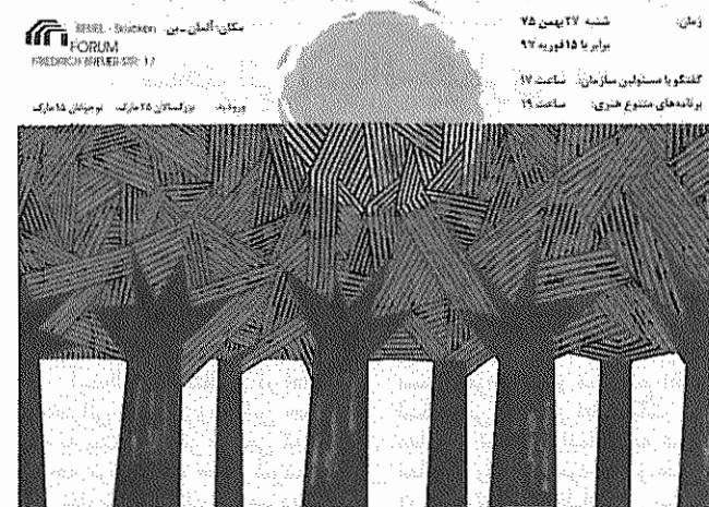
سازمان فدائیان خلق ایران (اکثریت)

در راه صلح، آزادی، دموکراسی و سوسیالیسم را گرامی بداریم!