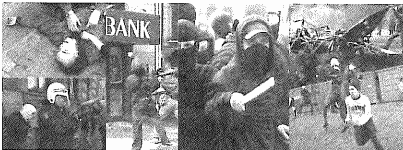
صحنه‌هایی از تجمعی از خیابان پلین و مردم در جریان سفر بوش به کشور سوئد

قائل باشند. یاری دهید تا یک حرکت عظیم با موضوعی شفاف، دموکراتیک و مسالمت‌آمیز در تظاهرات ۱۴ ژوئن داشته باشیم. و اما در ارتباط با حرکت اعتراضی بر علیه بازار مشترک اتحادیه اروپا، سازمان‌ها و احزاب مختلف سوئدی و غیرسوئدی بر آن شدند تا اعتراض خود را حول محور سه نکته زیر به جهانیان نشان دهند. الف - سیاست‌های غیر دموکراتیک بازار مشترک اروپا ب - انتقال فشارهای اقتصادی کشورهای جهان سوم ج - قراردادهای پلیسی و نژادپرستانه شکن و غیره دو شبکه اعتراضی به نام‌های شبکه گوتنبرگ دو هزار و یک (مستشکل از نیروهای چپ و