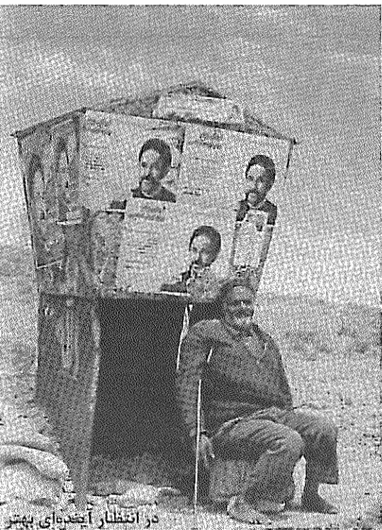
در انتظار آیت‌الله خمینی

پس از درج این سخنان، عسکراولادی طرح و هم طراح آن سال‌هاست در گذشته‌اند، گفته‌اند فرقی در اصل موضوع نمی‌کند. لابد شیطان بزرگ فکر همه چیز را قبلاً کرده بود. در همین بروجوه روزنامه «بهار» هم که پس از رفع توقیف فقط ۱۷ شماره آن درآمد بود، توقیف شد. قوه قضائیه لازم ندید که دلایل بستن این روزنامه را اصولاً پیدا کند و اعلام کند. خبرنگاران و نویسندگان و کارکنان دو روزنامه بیکار شدند و سه تن از کارکنان حیات نو دستگیر شدند. در محافل صحبت از این می‌رود که دلایل بستن این روزنامه‌ها به خرابی در مورد معاملات اقتصادی برمی‌گردد از جمله سود ۷۰ میلیارد تومانی صدا و سیما در پیش آگهی‌ها - ۴۰ میلیارد تومان توسط شرکتی که متعلق به روحانیونی از جمله هاشمی رفسنجانی و جنتی است. پس از درج این خبر شرکت رازی با مدیریت شخص ناشناسی به نام رسول گنجی اعلام کرد که خریدار بانک ملت او بوده است. گفته‌اند که این شخص ناشناس در حقیقت کارگزار همان شرکت روحانیون بوده است که بیش از همه غم اسلام و مستضعفین را دارد. در ادامه عکس‌العمل‌های مربوط به چاپ این کاریکاتور، حبیب‌الله عسکراولادی که با توجه به حمایت روحانیون انحصار واردات اقلام مهم از نیازهای کشور در دست اوست و نام این اقلام و سود او از معاملات، از رازهای نظام است ولی او هم‌چنان دغدغه اسلام عزیز را دارد و همواره نسیز در صحبت‌هایش به یاد اقسار آسیب‌پذیر جامعه است، در جمع طلاب و روحانیون تجمع‌کننده در حوزه علمیه مروی تهران سخن گفت. او حاضرین را از یافته‌های خود مستفیض ساخت