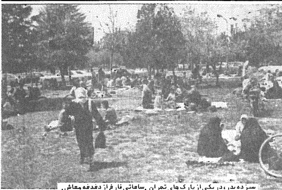
سیزده بدر، در یکی از پارک های تهران، ساهاتی فارغ از دغدغه معاش.

تسهیلات غیر ارزی آمده است که: دانشجویان ایرانی شافل به تحصیل در خارج که دارای اقامت دائم یا مرنوع اقامت غیر تحصیلی هستند در صورت سپردن تعهد بازگشت به کشور می توانند از تسهیلات غیر ارزی شامل امور گذرنامه رایگان، خروج دانشجویی، بلیطریالی رفت و برگشت به محل تحصیل، معافیت تحصیلی، صدور گواهی مختلف جهت امور محضری، بیمه، مستمری، وکالت و... استفاده نمایند.