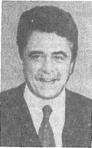
رفیق آخیله اوچتو دبیرکل حزب کمونیست ایتالیا

دبیرخانه کمیته مرکزی سازمان فدائیان خلق ایران (اکثریت) اسفند ماه ۶۷