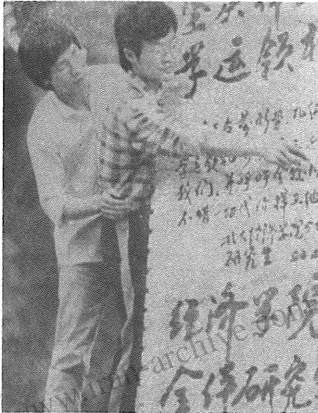
دانشجویان در حال نصب یک روزنامه دیواری

از همین زاویه نمی توان باین ارزیابی ”رن مین ریائو“ ارگان حزب کمونیست چین مبنی بر وجود ”توطئه ای از پیش طراحی شده“ و ”تلاش برای زیر سؤال بردن نقش رهبری حزب و نظام سوسیالیستی“ موافق بود. از یکسو محتوای خواست های دانشجویان (که براساس گزارش های مختلف حمایت مردم را نیز جلب