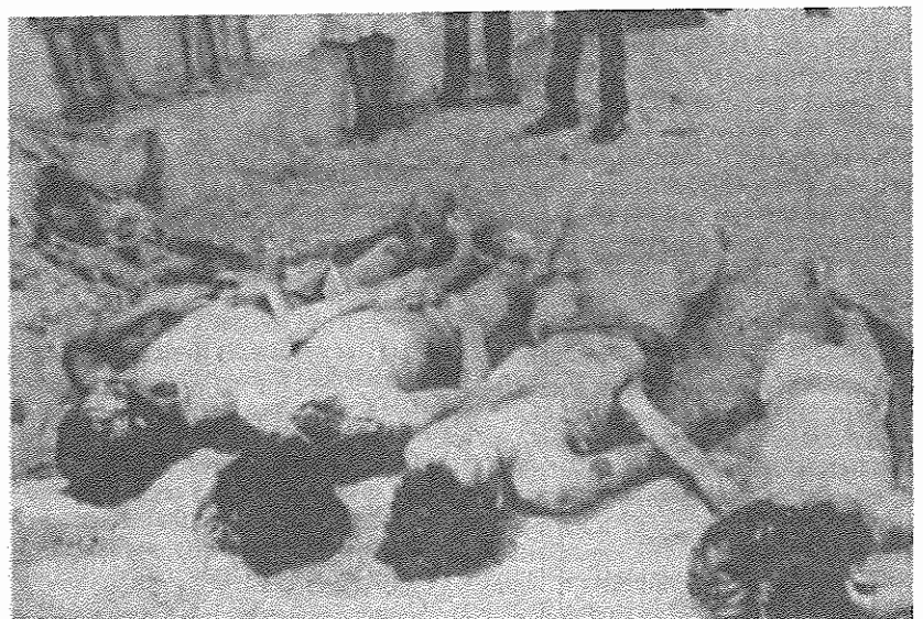
۸ سال جنگ در السالوادور: تصویری از وقایع و زمره

ایالات متحده آمریکا در نظر دارد گروه‌های ضدانقلابی نیکاراگوئه را در مبارزه انتخاباتی (که در ماه فوریه ۱۹۹۰ برگزار می‌گردد) مورد حمایت کامل مالی قرار دهد. روزنامه «نیویورک تایمز» ضمن پخش این خبر افزود که ۲ میلیون دلار جهت چاپ پوسترهای تبلیغاتی و آگهی‌های سیاسی و برگزاری گردهمایی‌های انتخاباتی در نظر گرفته شده است. علاوه بر آن مبلغ ۱۰۰ هزار دلار که تاکنون سالانه برای انتشار روزنامه اپوزیسیون «لایرنسا» پرداخت می‌شد، به ۲۲۰ هزار دلار افزایش خواهد یافت. میزان ۱۷۴ هزار دلار نیز جهت آموزش گروه‌ها برای شرکت در مبارزه انتخاباتی و چگونگی پیشگیری تاکتیک‌های انتخاباتی در نظر گرفته شده است.