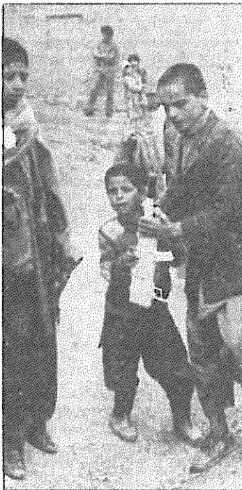
آینده کودکان افغانی دستخوش مصلح جنگ افروزان

عملیات نظامی برای تسخیر جلال آباد در اوایل ماه مارس توسط مشاوران دولتی پاکستان طراحی شد. در این جلسات سفیر آمریکا در پاکستان شرکت داشته است و از مجاهدین افغانی هیچ کس در طراحی عملیات شرکت داده نشده است. یکی از مشاوران بی نظیر بوتو گفت شرکت مشاوران دولت پاکستان به این دلیل بوده است که مجاهدین افغانی پس از عقب نشینی نیروهای شوروی تاکنون هیچ گونه پیروزی نظامی بدست نیاورده اند.