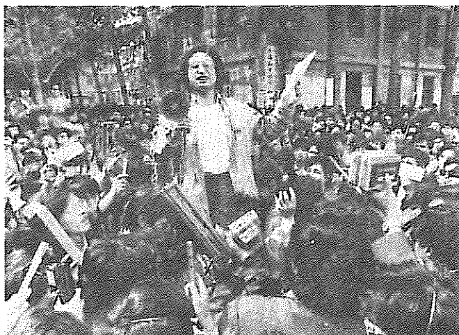
صحنه‌ای از راهپیمایی میلیونی

دانشجویان نیازمند پاسخ‌یابی جدی است. گزارش‌ها وجود نوبی سردرگمی را در سیاست حزب و دولت نشان می‌دهند. روندهای مفتی‌گذشته نشانگر گسترش کیفی اعتراض‌ها (شرکت افشار مختلف اجتماعی) بودند و این امر طبیعتاً نگرانی دولت را مبنی بر عدم کنترل راه‌پیمایی‌ها و جنبش اعتراضی برمی‌انگیزد. در اینجا این سوال پیش می‌آید که نظر دولت از اعلام وضع فوق‌العاده چیست؟ هدف از اعلام وضع فوق‌العاده مبارزه با "هرج و مرج" است. از این سخن تلاش برای کنترل این جنبش برمی‌آید. اما سوال اصلی بر جای می‌ماند: نظر حزب و دولت پیرامون خواست‌های دانشجویان و سایر محافل اجتماعی چیست؟ به نظر می‌رسد دیگر از عناصر ضد سوسیالیست و "خرابکار" سخن نمی‌رود. از سوی دیگر مذاکرات هر چند نیمه‌تمام با دانشجویان صورت گرفته است. اما ضرورت پرداختن صریح به خواست‌های مطرح شده هر چه بیشتر در مقابل رهبری کشور قرار می‌گیرد انجام فرم‌های سیاسی، گسترش دموکراسی در زندگی اجتماعی و مبارزه با پدیده‌های منفی چون رشوه خواری، نیازهای روز جامعه چین هستند. میخائیل گارباچف به درستی گفته است: اکنون در تمامی کشورهای سوسیالیستی روند نواندیشی و نوسازی در جریان است. امری که سوسیالیسم را به دوره‌ای نوین ارتقا خواهد داد. هر چند مرحله‌ای "در دامین" به همراه داشته باشد.