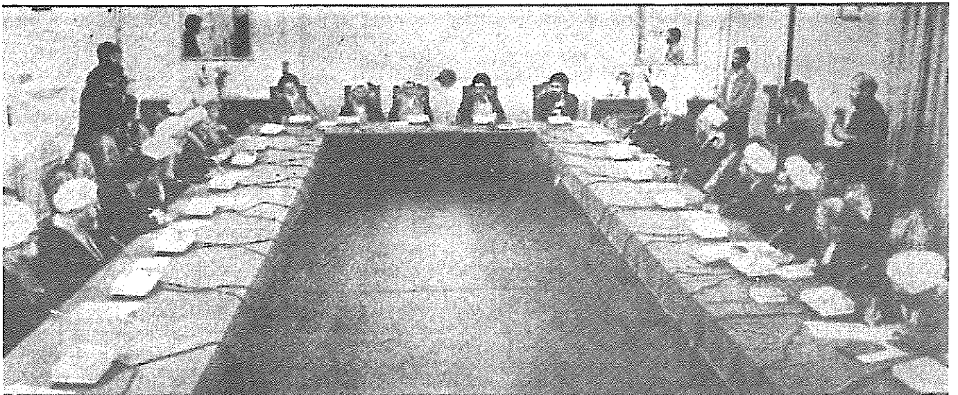
جلسه اعضای شورای بازنگری قانون اساسی، آخوندها همواره به همراه شسته اند

در مورد تغییر در اصل قانون اساسی راجع به انتخاب رهبر و شرایط رهبری تنها اعلام شده است که کمیسیون مربوطه به ریاست موسوی اردبیلی تشکیل جلسه داده و به بحث و گفتگو در