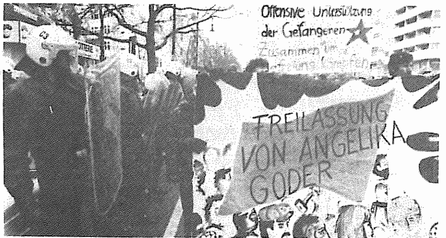
تظاهرات در حمایت از خواسته های زندانیان "فراکسیون ارتش سرخ"

روز چهارشنبه ۱۷ ماه مه، ده هزار نفر از مردم شهر کوانگ چو بدون توجه به بسیج گسترده پلیس، برای گرامیداشت سالگرد قیام کوانگ چو به راه پیمایی پرداختند. در قیام کوانگ چو در ماه مه سال ۱۹۸۰، ۲۰۰۰ نفر توسط پلیس و ارتش به قتل رسیدند. "چون توهوان" دستور سرکوب خونین قیام کوانگ چو را داده بود.