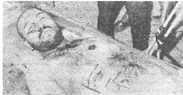
از قربانیان تروریسم جمهوری اسلامی در مکه