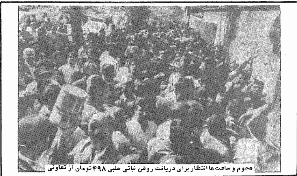
مجموع و ساعت ها انتظار برای دریافت روغن نباتی حلبی ۴۹۸ تومان از تعاونی

چون منتظری و نخست وزیر هر یک به نوهی مفضوب شده اند، طرفداران آنها در پائین به هم احساس نزدیکی می کنند. بطور نمونه می توان موضع گیری دفتر تحکیم وحدت در مورد منتظری و یا مورد اعتراضات دانشجویی در دانشگاه تبریز را ذکر کرد. در دانشگاه تبریز طرفداران منتظری و نخست وزیر یعنی تقریباً نیمی از افراد انجمن اسلامی نیز در اعتراضات دانشجویی حضور داشتند و می خواستند حرکات را مطابق میل خودشان سمت دهند که از دستشان خارج شد."