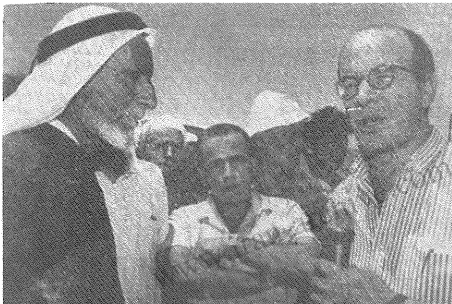
تسوکر (سمت راست) نماینده پارلمان اسرائیل و ابوهلی کدخدای ده نهالین نشان می دهد.

دولت اسرائیل برای ۵۰ هزار کارگر فلسطینی که برای کار از مناطق اشغالی به اسرائیل می روند، کارت شناسایی برای عبور از مرز صادر کرده است. فراتر از آن این کارگران باید هلاکتی را بر لباس خود حمل کنند که روی آن نوشته است: "کارگر خارجی". این حرکت نژادپرستانه با مخالفت افکار عمومی در داخل و خارج از اسرائیل مواجه شده است. یکی از نمایندگان پارلمان این کار را با دوران فاشیسم هیتلری مقایسه کرد که