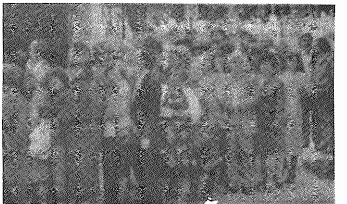
صف تعدادی از شمولان بوخارست برای شرکت در رای گیری ۲۰ ماه مه

مهر و برترین فرمانده نظامی نیروهای کنتررا (ضد انقلاب) در نیکاراگوئه موسوم به "فرمانده فرانکلین" که نام واقعی او اسرائیل گالیانو است، اعلام کرد نیروهای تحت فرمانش تحویل سلاحهای خود را متوقف کرده و توافق حاصله با دولت چامورو در این زمینه را به حالت تعویق درآورده اند. در بیانیه گالیانو آمده است دولت خانم چامورو به وعده های خود عمل نکرده است.