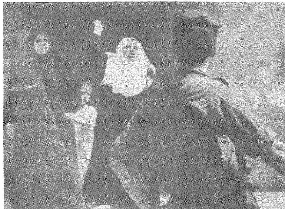
نوار فزه، دوشنبه ۲۱ ماه مه: یک زن فلسطینی به بازداشت پسرش توسط نیروهای اسرائیلی اعتراض می‌کند