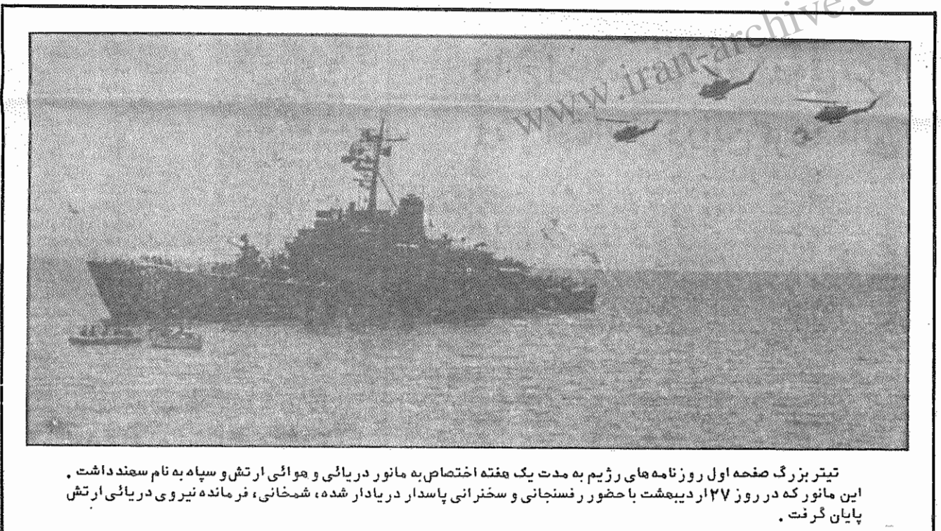
تیتزر بزرگ صفحه اول روزنامه های رژیم به مدت یک هفته اختصاص به مانور دریائی و هوائی ارتش و سپاه به نام سمند داشت. این مانور که در روز ۲۷ اردیبهشت با حضور رفسنجانی و سخنرانی پاسدار در یادار شده، شمخانی، فرمانده نیروی دریائی ارتش پایان گرفت.

باید به نظر می رسد بعد از این یورش گسترده، حقایع هوامفریبی رفسنجانی که می گویند نومی انعطاف پذیری به نمایش بگذارند، برای کسی رنگی داشته باشد و باز بعید است که سران حکومت بدون در نظر گرفتن عواقب این تعرض، آن را سازمان داده باشند. گویی رژیم تصمیم گرفته لاقبل در مورد "شئون اسلامی"، هرگونه نرمش را کنار بگذارند، به ویژه وقتی قدرت نهایی، بتواند بطور موقت هم که شده، روحیه "برادران حزب الله" را تقویت کند.