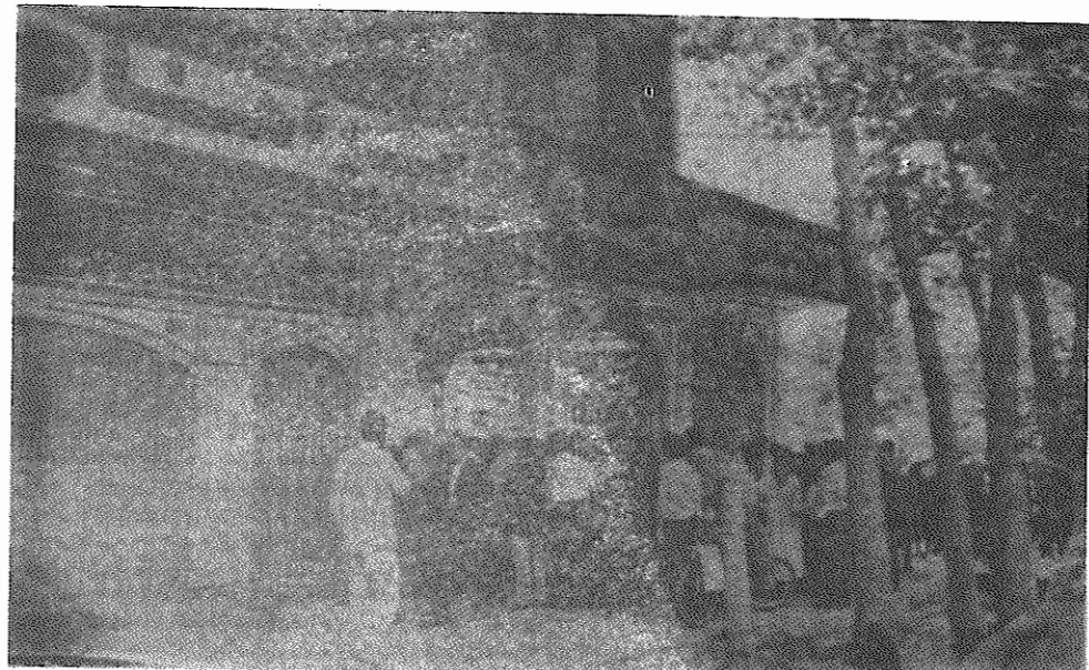
تهران - ۲۵ اردیبهشت - طلبکاران شرکت مضاربه‌ای دولتخواهان برای دریافت سپرده‌های خود در برابر دفتر این شرکت اجتماع کرده‌اند

شرکت‌های مضاربه‌ای در طول چند سال این سودهای کلان را به سپرده‌گذاران خود پرداخته‌اند و بیهوده نبود که "جنبش مضاربه" تا این حد فراگیر شد و حتی - به نوشته مطبوعات - دانشجویانی را در برگرفت که با گذاشتن ۲۰۰ - ۳۰۰ هزار تومان ارث یا کمک پدری به مضاربه، مخارج خود را تا حد بخور و نمیر تامین می‌کردند.