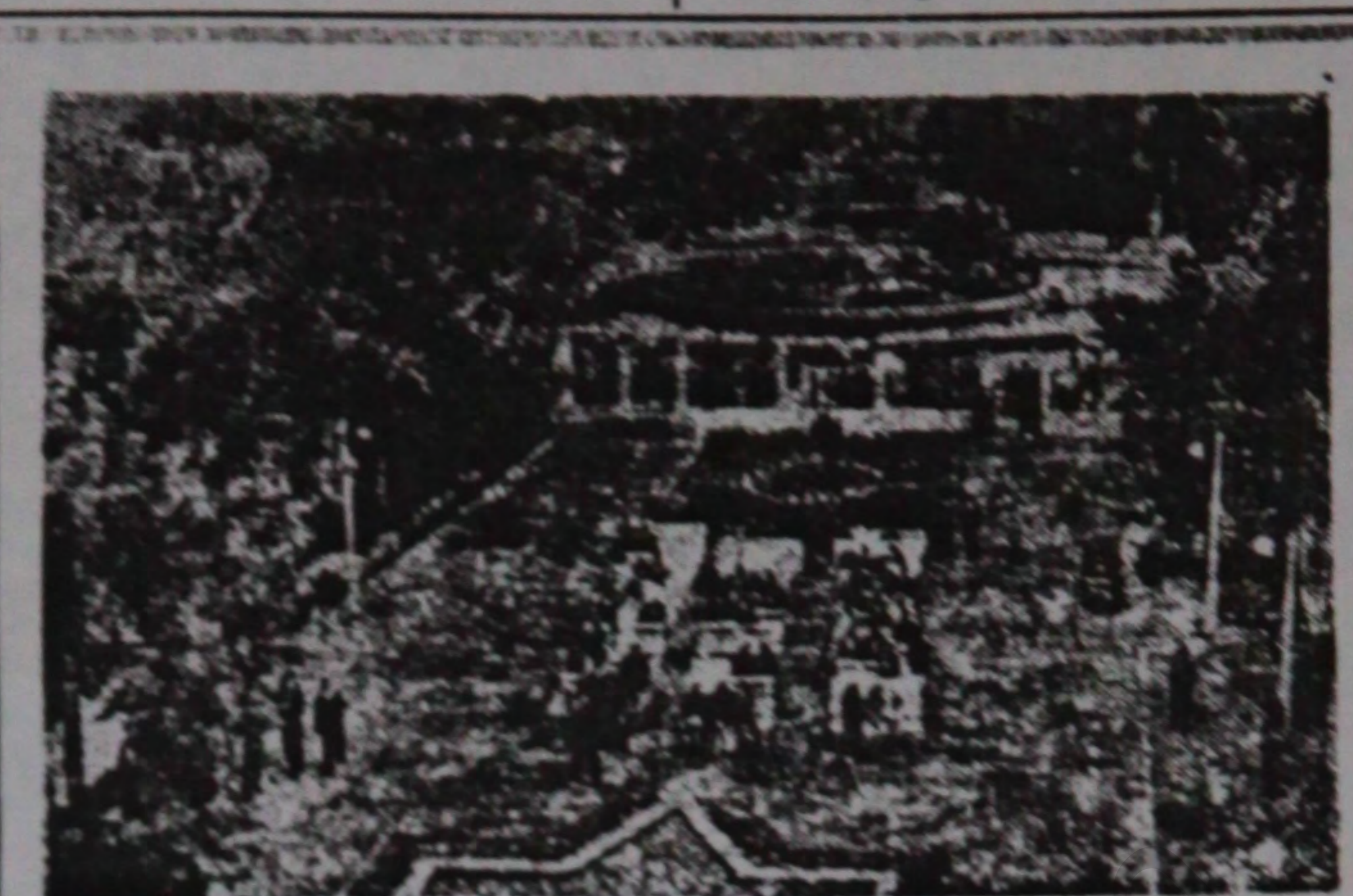
تبریزده کی سوومت مدنیت ایوبی ده حوطه سیندن منظره

بو رحسترین هاموسینی نظره دوتدا. فلا برابر ، وارغ و مالک آراسیندا بوکیسی عادلانه قانون وقراری بونون رلوع و مالک لر باغشی استقبال ایدیب و بونون دولگون صورتده اجرا ایدیله سینده حاله شانلاری گورله نلیر