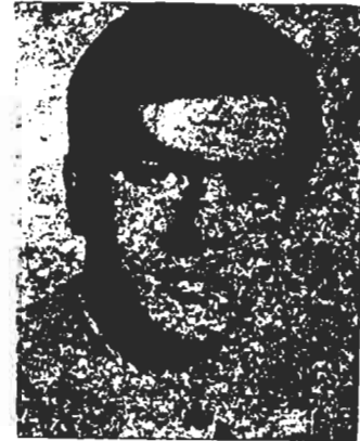
فدائی شهید فرامرز شریفی

در زندگی دیگران داشته باشد. رفیق فرامرز فرماندهی تیمی را در بخش تحت مسئولیت رفیق مهدی بعهده داشت. رفیق فرامرز در نامه‌ای که در زمان زندگی منشی خود برای خانواده‌اش فرستاد چنین نوشته است: «این راه اصلی زندگی و بزرگترین هدف من است. خوشحالم از اینکه میتوانم در راه انقلاب قهرآمیز خلق ایران عضو یک سازمان پیشاهنگ باشم.» رفیق فرامرز در مردمان ۵۱ همراه با مهدی فضیلت کلام و فرخ سهری در یک درگیری نابرابر با مزدوران ساواک پس از ۵ ساعت نبرد با ممنوع‌کردن تعدادی از مزدوران کتیف ساواک، هنگامیکه حتی آخرین گلوله‌های خود را نثار مزدوران ساواک کرده بود با دردمند داشتن یک نارنجک آساده انفجار خود را به میان دشمنان خلق پرتاب نمود و با ازبین بردن هم‌دای از مزدوران بنزدگی پراختار خود پایان داد. یاد او فداکاران را همواره در خاطرها جاودان خواهد ماند.