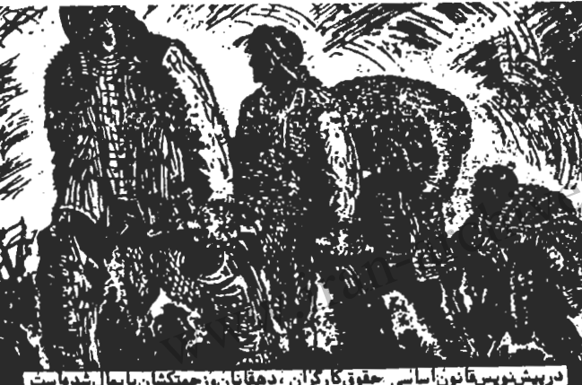
در پیش‌نویس قانون اساسی حقوق کارگران، دهقانان و زحمتکشان پایمال شده است

وظیفه مقدم هر انقلاب و از جمله انقلابات دموکراتیک و رهائی‌بخش، درحسب کوبیدن ارکانهای سیاسی و نظامی حمرام با آن نابودی کل روابط و ساختن سیاسی جامعه گفته است. چنین کوششی که لازمه بنیان‌گذاری اقتصادی سالم و آزاد و نوین است در پیشانی وظایف انقلابیون قرار می‌گیرد. ویژگی سیاسی جامعه جدید که با انقلاب دموکراتیک و رهائی‌بخش ساختن آن آغاز میگردد در دو اصل و دو نکته اساسی خلاصه میگردد. ما مقدمتا به این دو نکتت که نقش تعیین کننده‌ای را در سیستم سیاسی جامعه‌ای بقیه در صفحه ۴