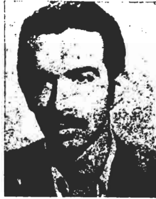
رفیق شهید مهدی فضیلت کلام