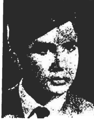
رفیق شهید لرخ سهری