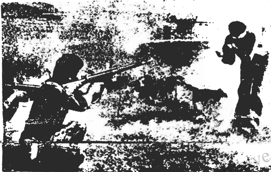
دلاورانه مردن و تخفیر جلادان کار توست . تو همیشه زندم ای ، اما دژخمانی که امروز به قلب تو نشان فرقت اند ، در دل تاریخ گور خود را می کنند . آنها از هم اکنون مردمانند . صحنه ای از جنایات ارتجاع در سقز - اینجا در کنار مهابادی کتیر باران می شود ، تیر باران شده های قبلی به خون غلطیده ماند .