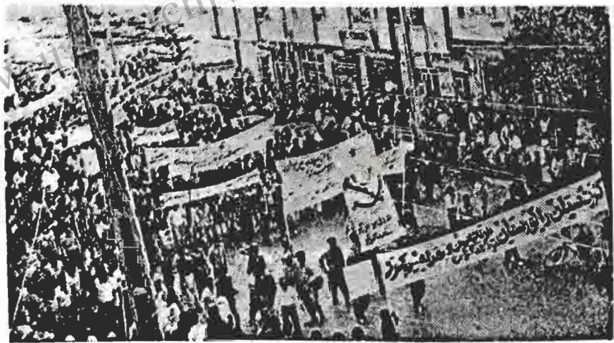
سنج - صحنه ای از تظاهرات و راهپیمائی خلق کرد برای گرامی داشت شهدای جنگ خونین کردستان

برای گرامی داشت شهدای جنگ خونین کردستان "در پیکار خلق کرد سازشکاری محکوم است"