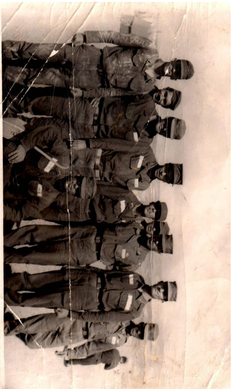
ستار ( نفر نشسته ) در دوره آموزشی یک ماهه پایداری در جین دانشگاه 1348