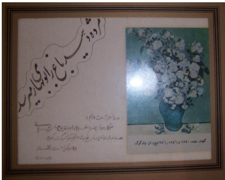
کارت شادباش نوروزی ستار به خانواده - بهار ۶۶