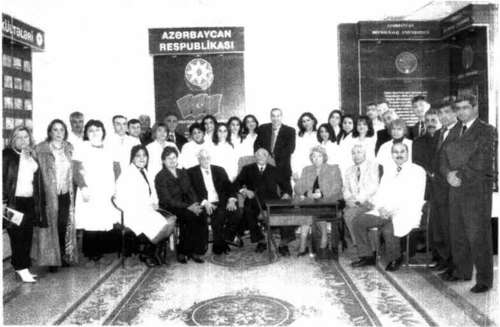
آذربایجان بئین الخالق اونیورسیتیه سی - میر خسته خاناسی نین آچیلیشی

من ده بۇ بۇیوکلریمیزله بیرلیکده جناب دوکتور هیئته احتیراملاریمی و تشکۆرلریمی بیلدیرمک ایستردیم. انشاءالله بونون کیمی مراسیملر هر ایل ایران و تۆرکیه نین بیرلیگی اؤغرונدا اۆرکدن چالیشان دیگر شخصیتلر، متلاً دوکتور احمد بیستارلی اۆچۆن ده کئچیریلسین.