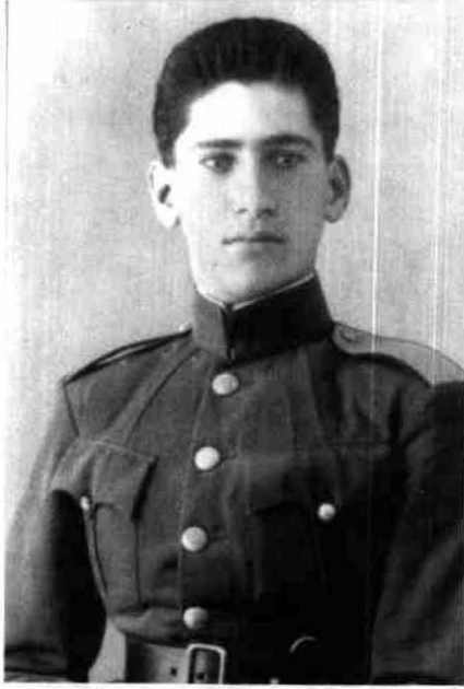
دوكتور هيئتین گنجلیگی