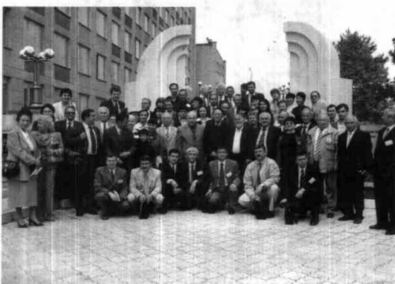
كىرىمدا تۆركولوژى قۇرولتايى ۲۰۰۴