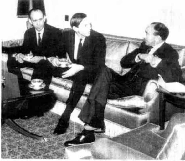
گوئتی آفریقالی حکیم - جراح کریستیان بارناردلا بیرلیکده